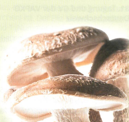
Shiitake ( Lentinula Edodes )