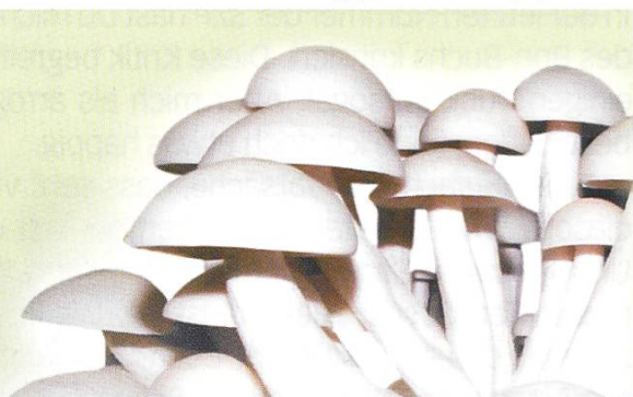
Shimeji/Buchepilz ( Hypsizygus tessulatus )

Schweizer Pilze – täglich frisch auf Ihrem Tisch