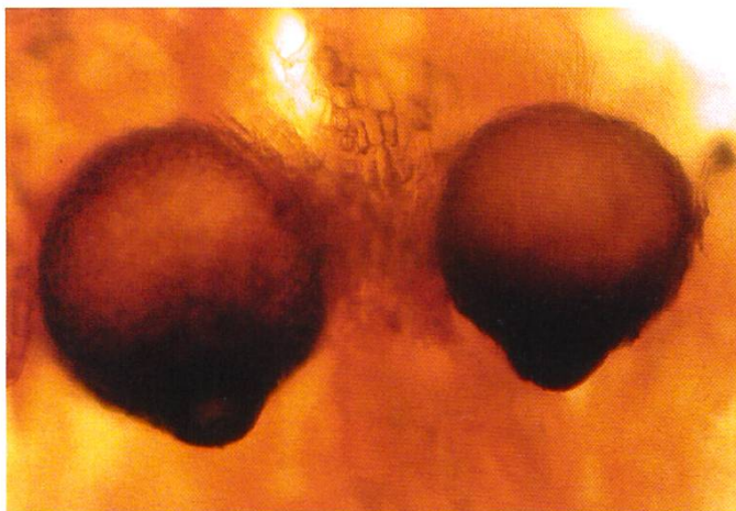
Fruchtkörper von Lizonia emperigonia Fructifications de Lizonia emperigonia

29.09.1989. BE, Wahlern, Schwarzwassergraben, 592 m, an Polytrichum formosum , 9.02.1995. LU, Entlebuch, Mettelimoos, Moor-Fichtenwald, 1020 m, an Polytrichum formosum , 29.09.1988. VD, zwischen Les Plans-sur-Bex und Pont-de-Nant, 1100 m, Tannen-Buchenwald, an Polytrichum formosum , 17.08.1992.