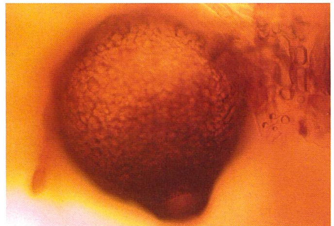
Asci von Lizonia baldinii Asques de Lizonia baldinii