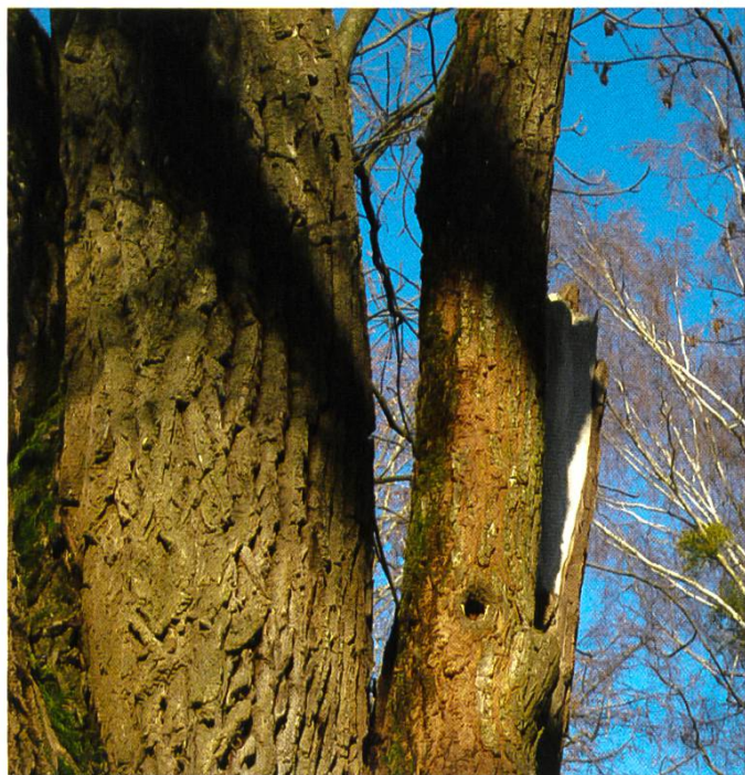
Phellinus ferruginosus Rostbrauner Feuerschwamm Phelin ferrugineux

En tenant compte des spécificités de leurs hôtes, les champignons dégradant le bois peuvent se répartir en trois groupes.