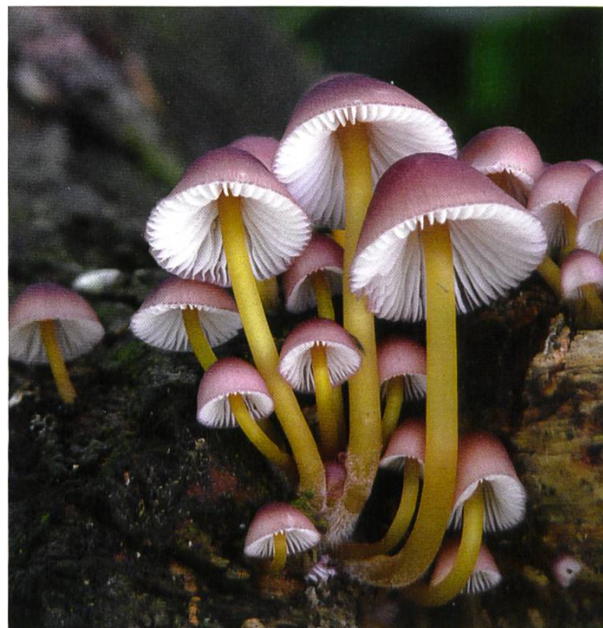
Mycena renati Gelbfüssiger Nitrat-Helmling Mycène à pied jaune