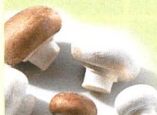
Champignon de Paris