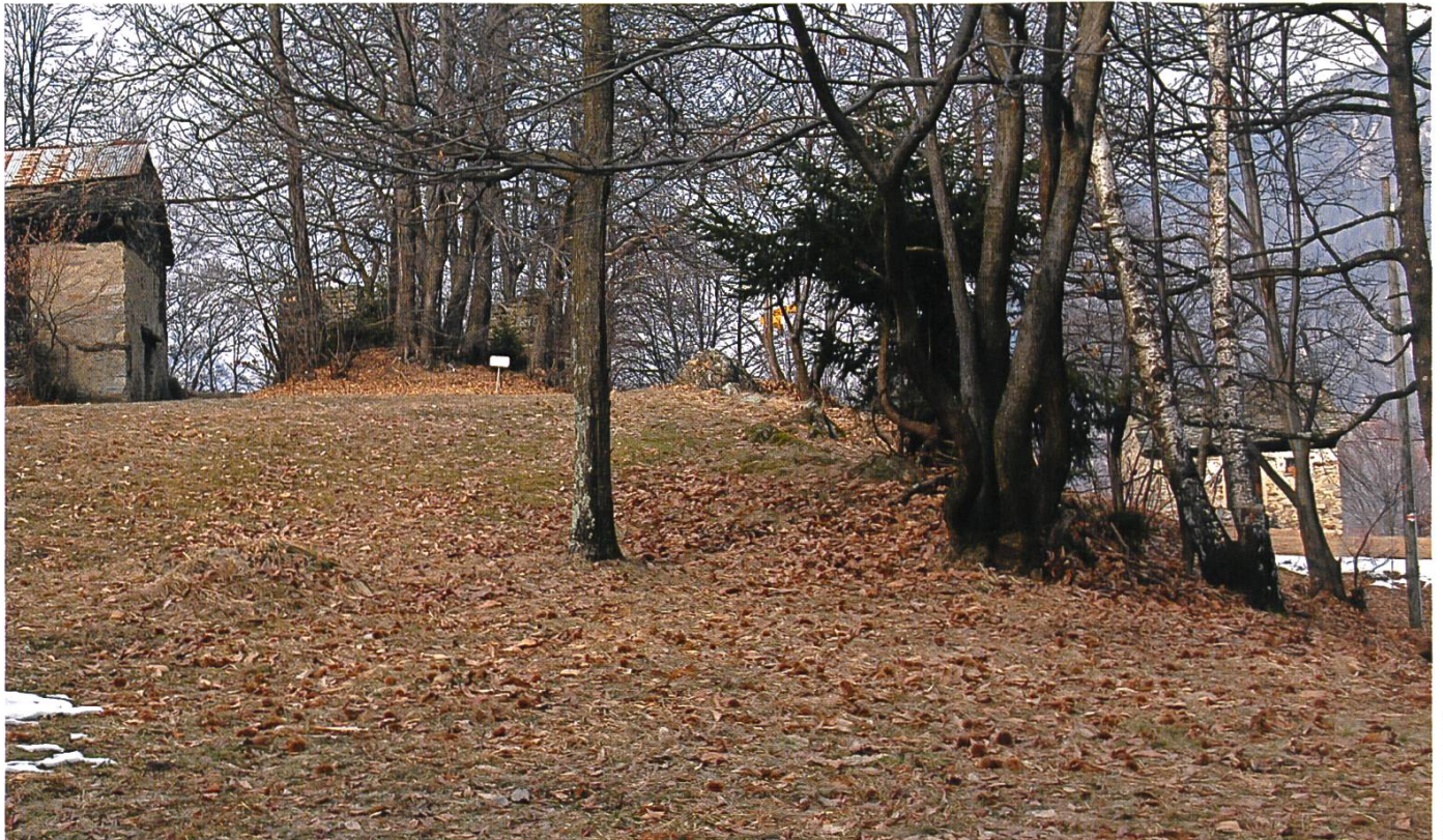
Russula convivialis Habitat con quercie | Habitat mit Traubeneichen | habitat avec des chênes

Stiel > 20–35×7–11 mm, zylindrisch oder schwach keulenförmig an der Basis, gegen oben geweitet. Anfangs ziemlich hart, dann weicher werdend und mit einem Mark gefüllt, zum Schluss hohl. Rostbraun an der Basis und an den verletzten Stellen, sonst weiss.