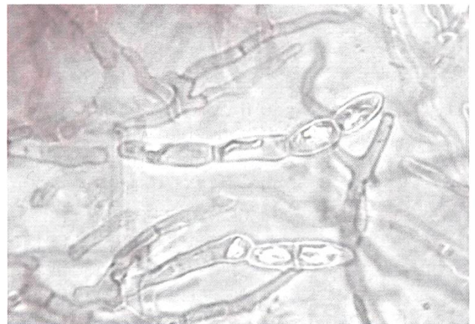
Russula convivialis Kutikula: Dermatozystiden und Haare | Cuticola: dermatocistidi e peli | Cuticule: dermaocystides et poils