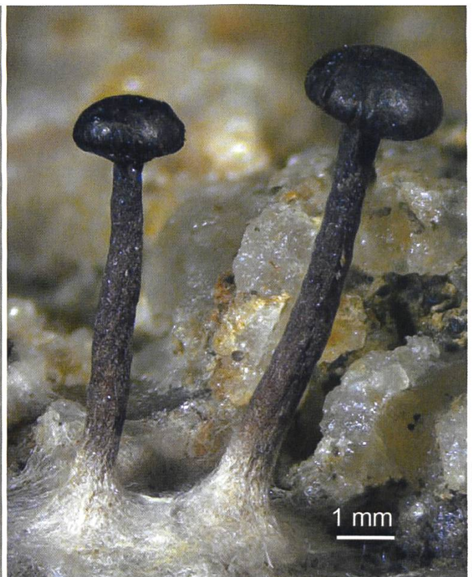
Heydenia alpina Die Peridien sind abgesplittert und die blasse Sporenmasse ist sichtbar.