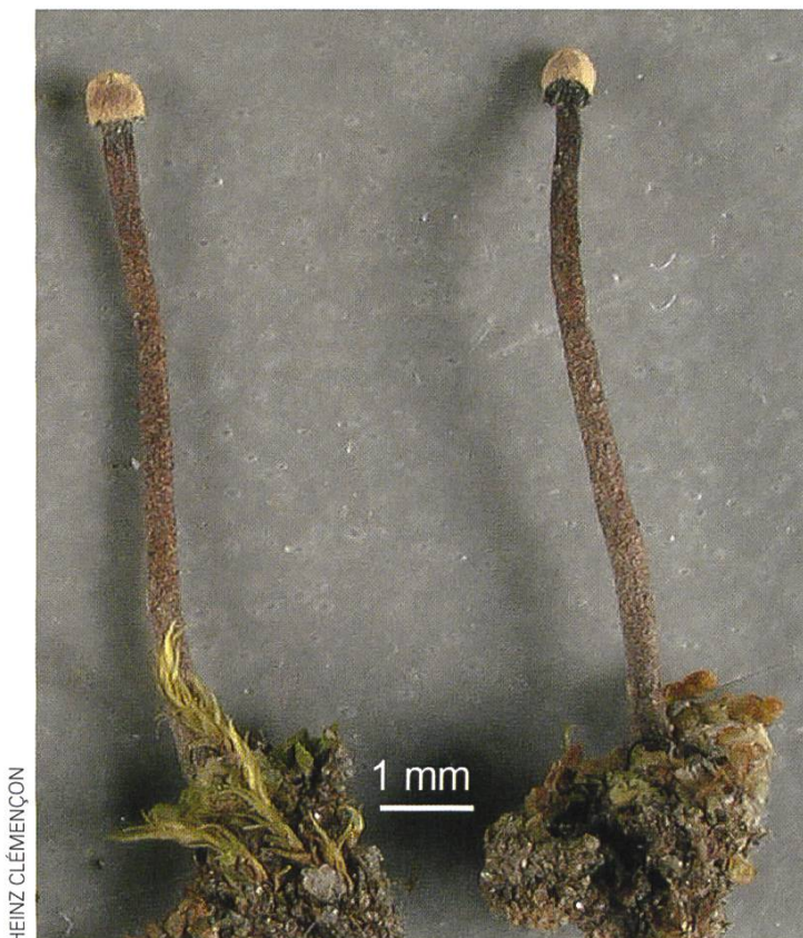
Heydenia alpina Die Peridien sind abgesplittert und die blasse Sporenmasse ist sichtbar.

Die morphologische Untersuchung mehrerer Aufsammlungen verschiedener Heydenien führte zur Einsicht, dass deren Sporen keine Konidien sind, wie allgemein angenommen wurde und wie ich das in der SZP 5/2007 schrieb, sondern dass es sich um Ascosporen handelt, wie das bereits Höhnel (1915) vermutete. Der Vergleich der Heydenia -Fruchtkörper mit den Cleistothecien der Orbicula parietina aus der unmittelbaren taxonomischen Nachbarschaft der Heydenien zeigte so grosse Übereinstim-