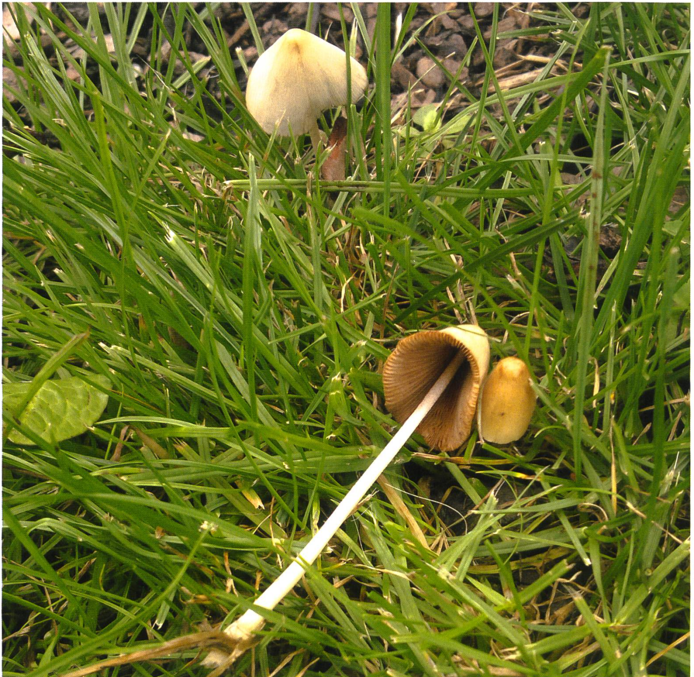
Conocybe lactea Milchweisses Samthäubchen, kein Speisepilz.

gut einjähriges Kleinkind habe Pilze auf einer Wiese eines Spielplatzes geschluckt. Bis jetzt seien glücklicherweise keinerlei Beschwerden aufgetreten. Auf meine Frage, wie viele Pilze es gewesen seien, meinte sie: «Bloss ein kleines Stückchen von einem Fruchtkörper, aber sicher weniger als ein Quadratzentimeter.» Offensichtlich wurde sie bereits vom Tox-Zentrum über die