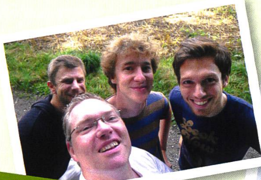
Das Team Pilzbueb freut sich auf den Verkauf am Markt

Lassen Sie sich persönlich überzeugen und besuchen Pilzbueb an den Märkten oder bestellen Sie online auf www.pilzbueb.ch .