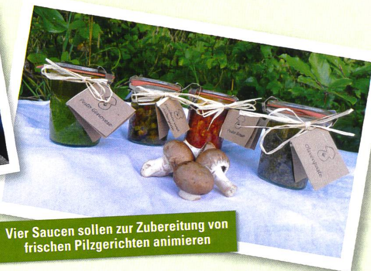
Vier Saucen sollen zur Zubereitung von frischen Pilzgerichten animieren