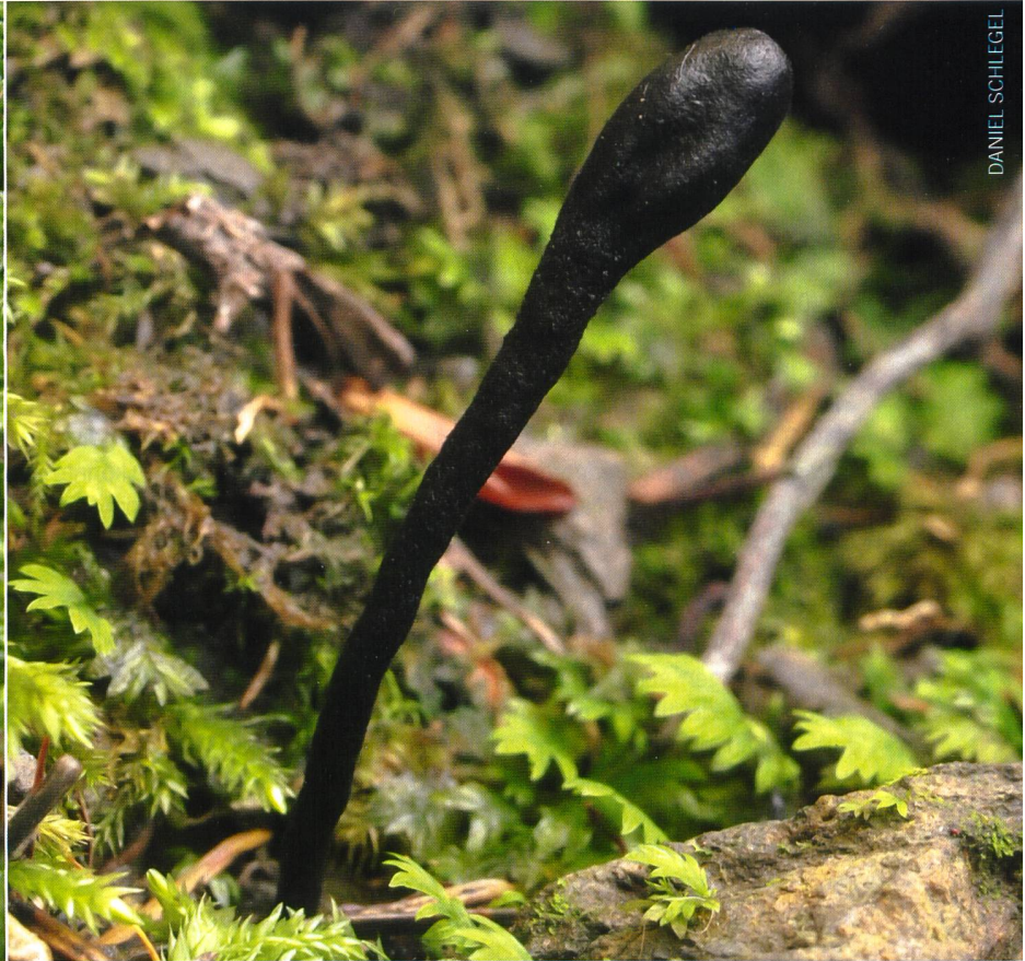
7. VIERSPORIGE ERDZUNGE ( TRICHOGLOSSUM TETRASPORUM )