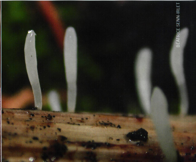
5. KOLBENFÖRMIGES SKLEROTIENKEULCHEN ( TYPHULA UNCIALIS )