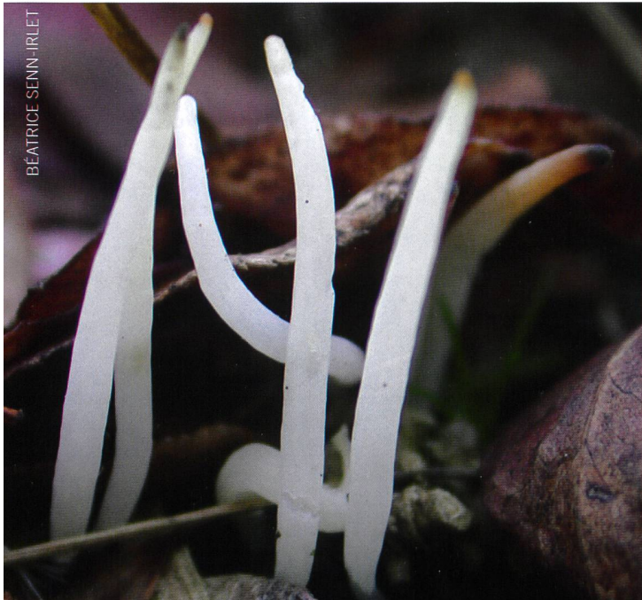
4. WEISSE KEULE ( CLAVARIA FALCATA )