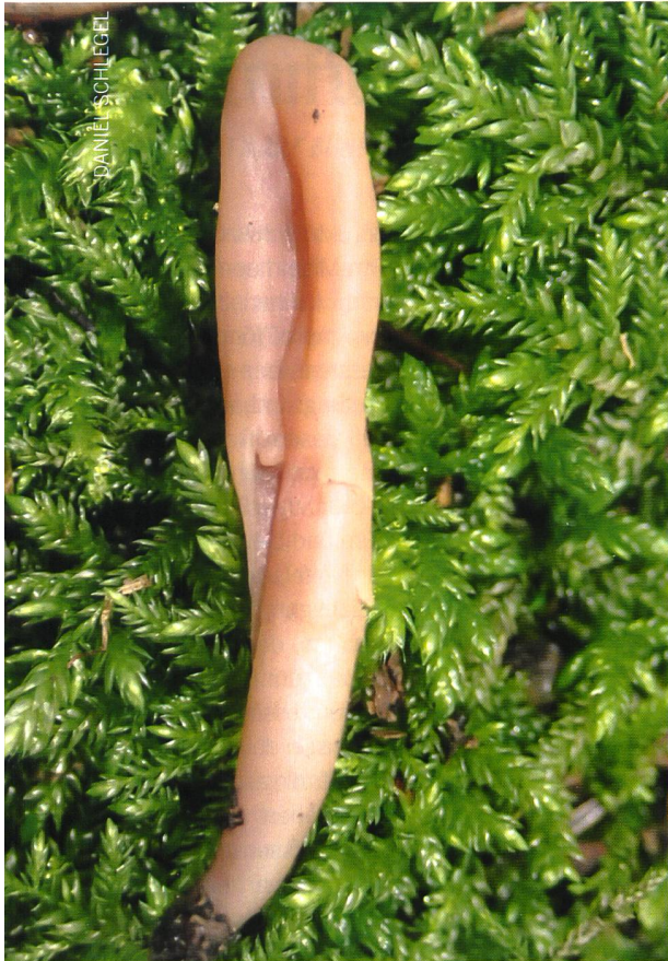
6. BRAUNROTE ERDZUNGE ( MICROGLOSSUM FUSCORUBRUM )