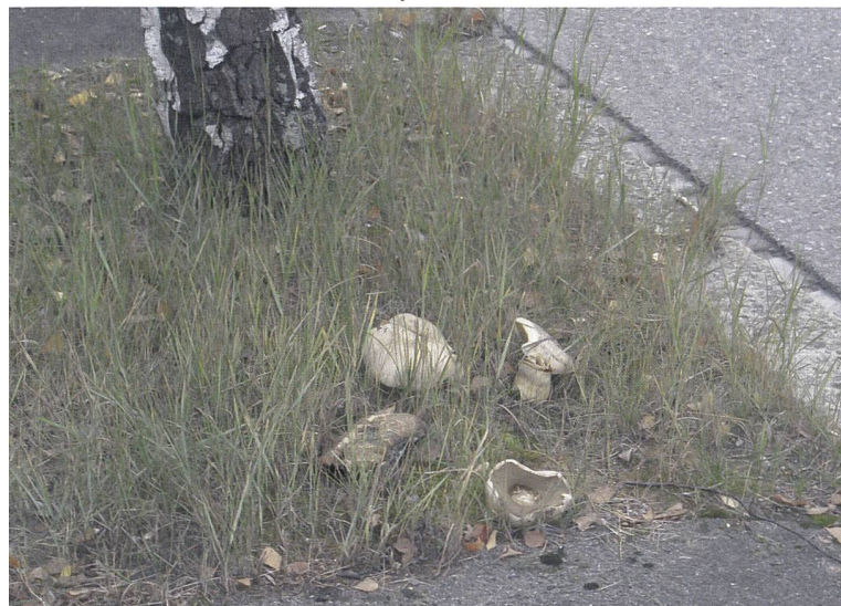
Abb. 5 Allee mit jüngeren Birken in Zürich ill. 5 Allée avec de jeunes bouleaux