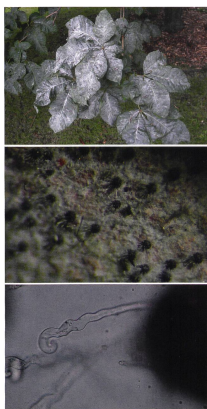
Abb. 3 ROSSKASTANIEN-MEHLTAU ( Erysiphe flexuosa ). Befallene Blätter, reife Fruchtkörperchen und Detail eines Anhängsels. Fig. 3 MILDIU DU MARRONNIER ( Erysiphe flexuosa ). Feuilles tombées, petites fructifications et détails d'un appendice de la fructification.

Die Echten Mehltau (Erysiphales) gehören ebenfalls zu den biotrophen Ektoparasiten, das heißt zu den Arten, die auf lebende Wirte angewiesen sind. Ihre Sporen keimen auf einer Blattoberfläche und bilden ein weisses feines Mycel. Durch den Sommer entwickeln sich Konidien (unter der Formgattung «Oidium» bekannt), die eine rasche Massenvermehrung bei für den Pilz günstiger Witterung erlauben. Im Herbst werden eigentliche Fruchtkörper gebildet: es handelt sich um kleine Kügelchen, die von bloßem Auge knapp erkennbar sind. Typisch für die Gattungen und die einzelnen Arten sind die Anhängsel, welche diese Fruchtkörper zieren (Abb. 6). Unter den Mehltau-pilzen finden sich viele wirtsspezifische Arten wie der Fliedermehltau ( Erysiphe syringae ) und der Rosskastanien-Mehltau ( E. flexuosa , Fig. 3), neben einigen nicht sehr wählerischen Arten wie dem Gemeinen Degen-Mehltau ( Phyllostictia guttata ), dessen Fruchtkörper an kleine Sputniks erinnern (Abb. 5).