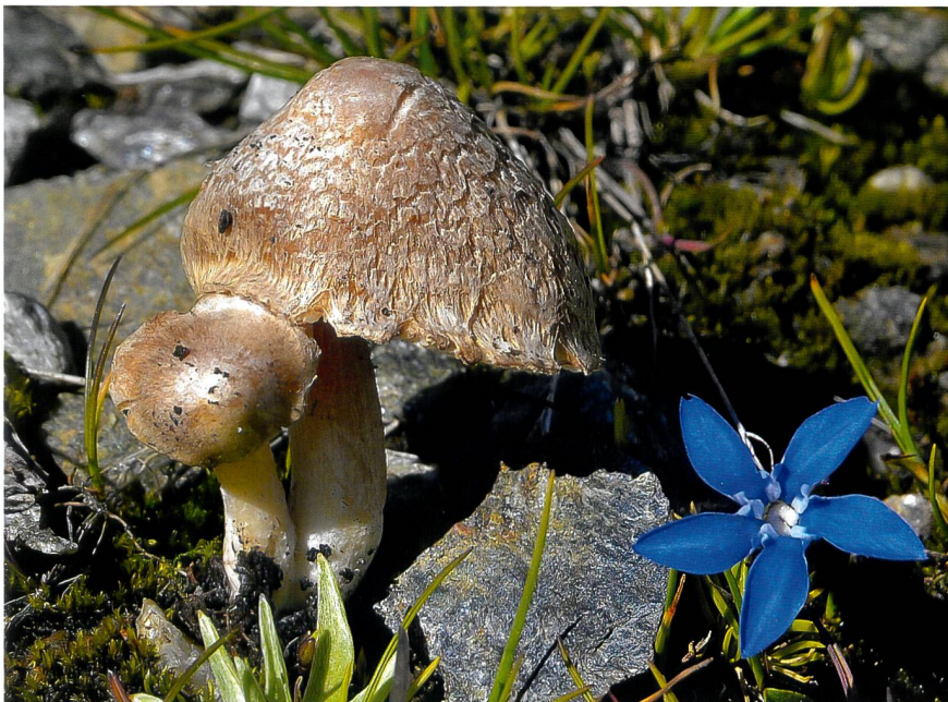
INOCYBE MOELLERI Corpi fruttiferi (a sinistra) | Frische Fruchtkörper (links); cheilocistidi e paracistidi a destra | Cheilo- und Parazystiden (rechts)

Svizzera, Canton Vallese, zona del passo del Sempione, versante sud, sentiero da Hopsche allo Spitzhorli, circa 2300 m s.l.m.; un esemplare, presso Salix herbacea; 30. VII 2006, leg. et det. E. Ferrari, in erbario EF 7/06; due esemplari, 5. VIII 2007, leg. et det. E. Ferrari, in erbario EF 22/07; due esemplari, 5. VIII 2015, leg. et det. E. Ferrari, in erbario EF 5/15.