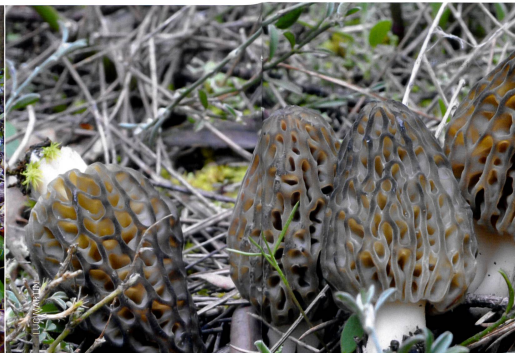
Unter Eiche, mars | März 2010.