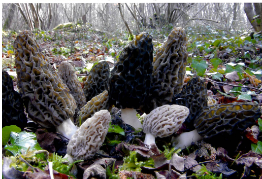
MORCHELLA DELICIOSA Oise (France | Frankreich), mars | März 2014