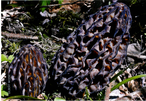
MORCHELLA PURPURASCENS Territoire-de-Belfort (Frankreich | France).