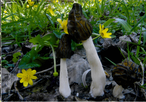
Espagne, avril 2013.