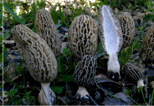
MORCHELLA TRIDENTINA Spanien, April 2013 | Espagne, avril 2013.