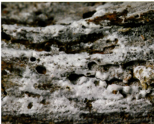
HYPHODERMA TIBIA Fruchtkörper | Fructifications