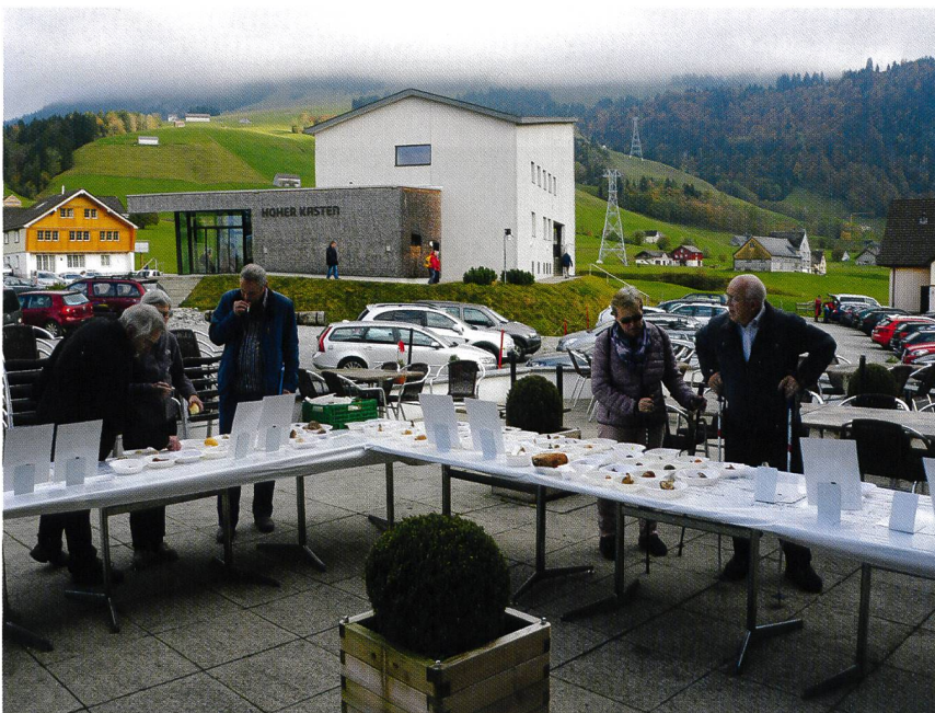
Eine grosse Vielfalt an Pilzarten Ende Oktober