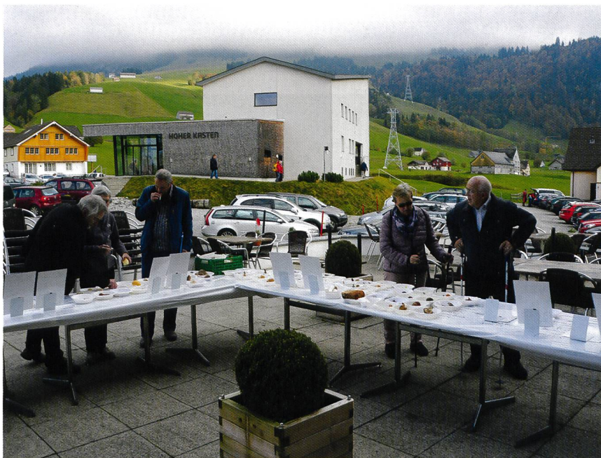
Eine grosse Vielfalt an Pilzarten Ende Oktober