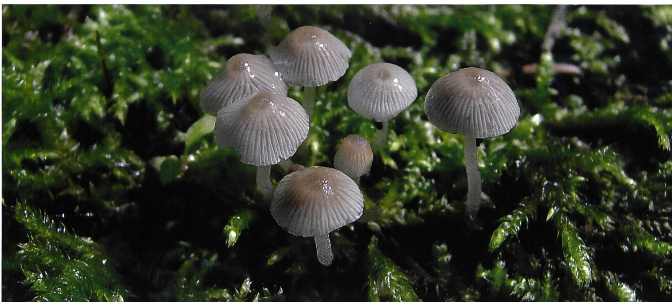
PSATHYRELLA PYGMAEA Zwergfaserling | Psathyrelle naine