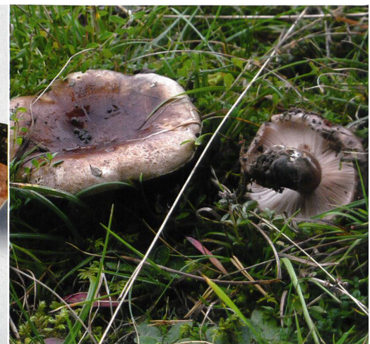
Abb. 6 Scharfblättriger Täubling ( R. acrifolia )