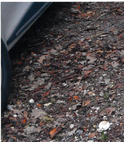
Fig. 1 Fructifications d' Agaricus bitorquis dans un parking | Abb. 1 Fruchtkörper des Asphalt-Champignons auf einem Parkplatz.