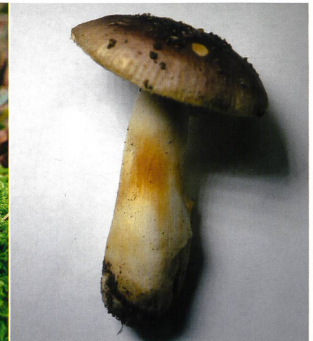
Abb. 25 Milder Wachs-Täubling ( R. puellaris )