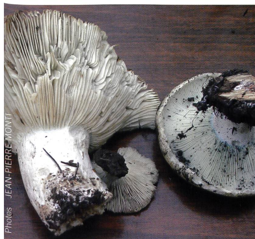
Fig. 9 Lames de Russula illota | Abb. 9 Lamellen des Morse-Täublings ( R. illota )