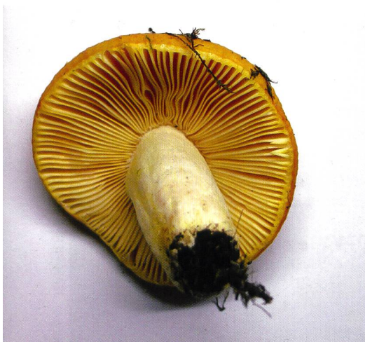
Fig. 22 Russula sanguinea | Abb. 22 Blutroter Täubling ( R. sanguinea )