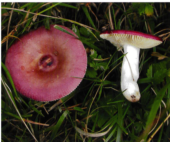
Abb. 19 Scharfer Braun-Täubling ( R. adulterina )