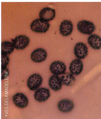
Abb. 4 Ornamentierte Sporen des Kleinsporigen Buchen-Speitzäublings ( R. mairei )