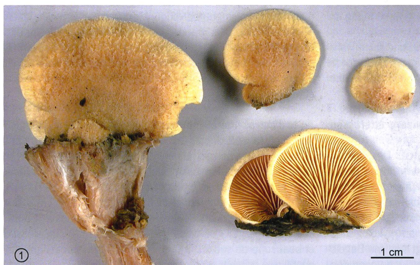
Abb. 1 Fruchtkörper des Orangeseitlings; das Exemplar ganz links sitzt auf einem Stück Holz, das auf seiner Bruchfläche das blasser Mycelium erkennen lässt.

gezeigt, und schliesslich sieht man in der Abbildung 4 die wichtige, oft unbemerkte und auch kaum bekannte Schleimhülle der Hyphen, mit deren Hilfe die Hyphe das Substrat, hier die Wand einer Holz-Zelle, enzymatisch angreift und ausserhalb der Hyphe verdaut. Alles Weitere steht in den Legenden.