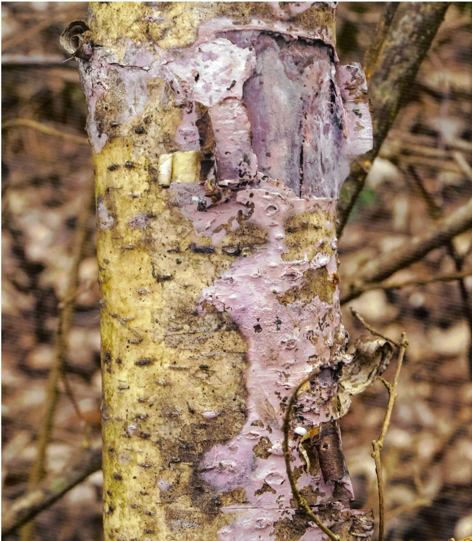
TULASNELLA VIOLEA Lilafarbener Wachskrustenpilz aus dem Staatswald bei Ins BE, fotografiert am 1. Januar 2019 | du Staatswald près d'Anet BE trouvé le 1 er janvier 2019