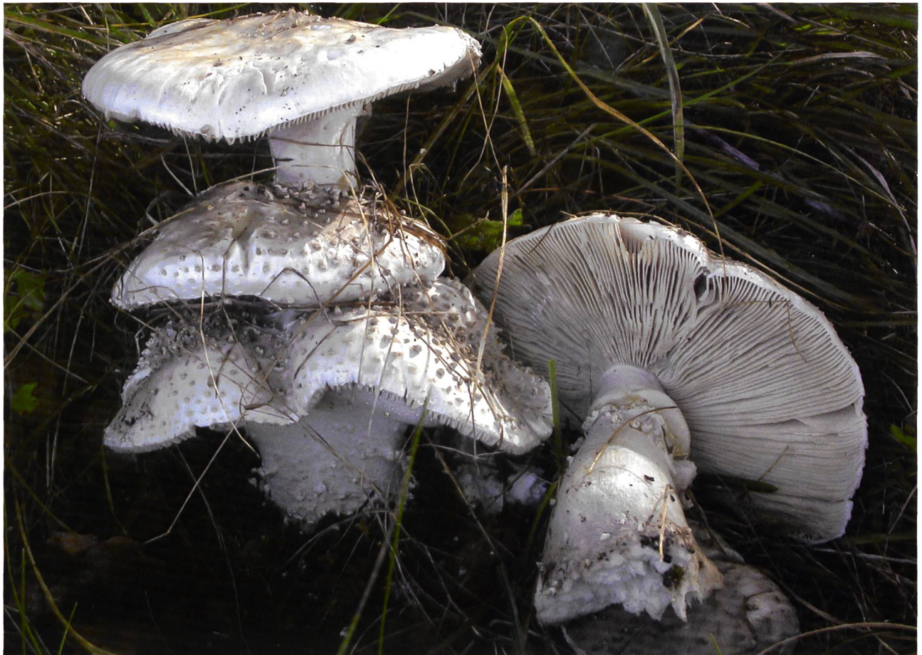
AMANITA ECHINOCEPHALA Stachelschuppiger Wulstling | Amanite à squames pointues