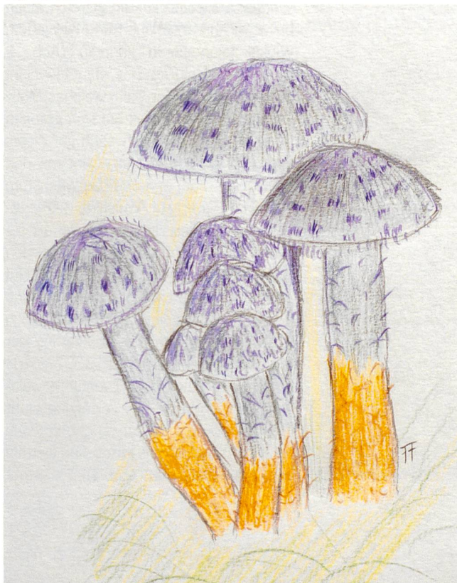
Fig. 6 | Abb. 6 SQUAMANITA PARADOXA

Toujours est-il qu'une rencontre avec de petits champignons à chapeau méchuleux, regroupés le plus souvent et associés à une masse fongique basale pourrait bien être une squamanite. Alors, soyons bien attentifs lors de nos futures herborisations!