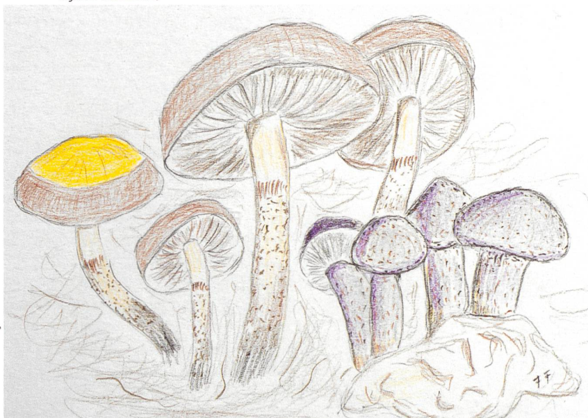
Abb. 8 Der Gefranste Schuppenwulstling mit seinem Wirt, dem Stockschwämmchen Fig. 8 SQUAMANITA FIMBRIATA avec son espèce-hôte, la pholiote changeante ( Kuehneromyces mutabilis )

Der Duftende Schuppenwulstling ( Squamanita odorata , Abb. 7) wächst auf dem