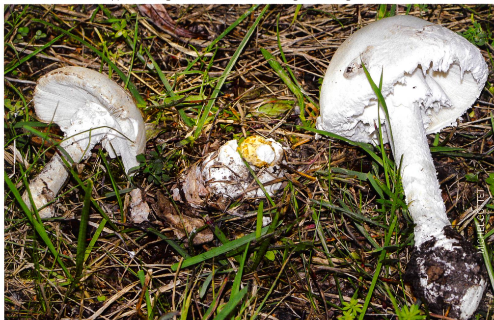
Fig. 3 SQUAMANITA SCHREIERI en compagnie de son hôte: Amanita strobiliformis Abb. 3 Der Gelbe Schuppenwulstling mit seinem Wirt dem Fransigen Wulstling

D'après SwissFungi, on a trouvé en Suisse 4 espèces, toutes très rares (entre 1 et 10 observations pour la période 1991-2018), et une 5 e est documentée par Breitenbach et Kränzlin (1995). Nous avons voulu accompagner la présente note par des planches originales dessinées à partir de différentes sources (photos d'Internet et littérature diverse).