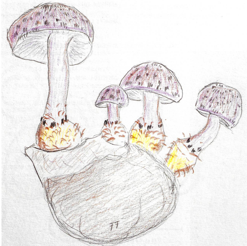
Abb. 7 | Fig. 7 SQUAMANITA ODORATA Duftender Schuppenwulstling

Da dieser Pilz nur einen sterilen Hut ausgebildet hatte, verzichtete ich auf eine komplette Beschreibung. Ich habe jedoch Bilder gemacht und das Exsikkat ins Herbarium Genf geschickt (N° G00273781), damit es in Zukunft für eventuelle weitere Untersuchungen zur Verfügung steht. Eine mikroskopische Untersuchung zeigte an der Basalknolle des Pilzes eine Vielzahl von Chlamydosporen (Abb. 4).