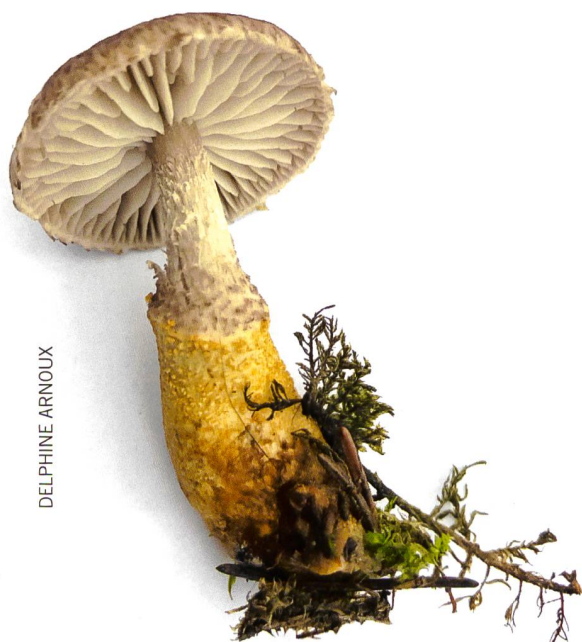
Abb. 1 Der Goldstiel-Schuppenwulstling, gefunden von Delphine Arnoux im September 2017 im Tal von La Brévine