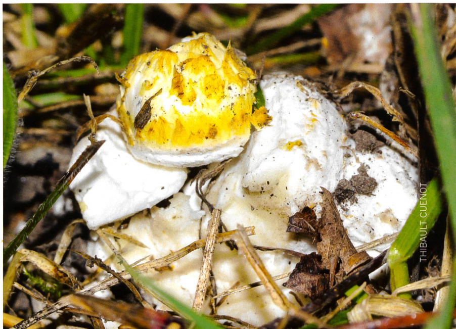
Abb. 2 Der Gelbe Schuppenwulstling, gefunden im Naturschutzgebiet Fanel im September 2018