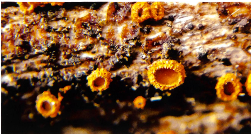
PERROTIA FLAMMEA Ascomi | Fruchtkörper