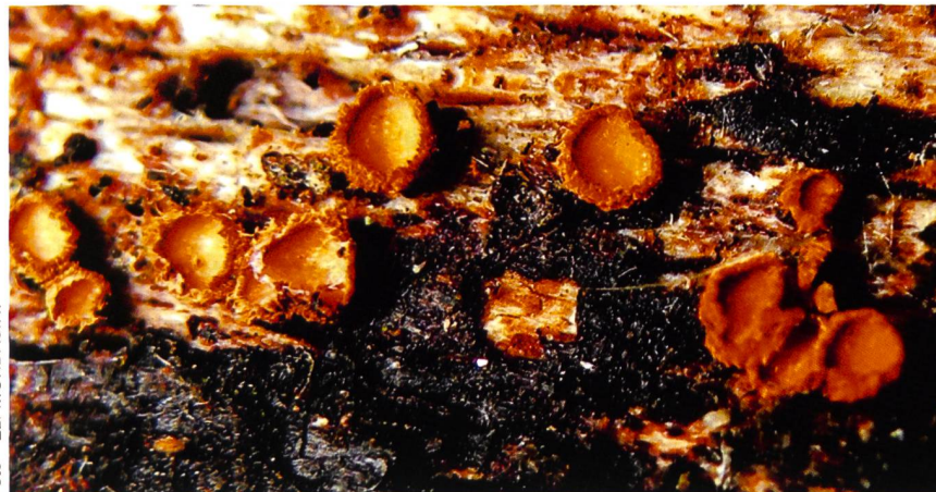
PERROTIA FLAMMEA Ascomi su ramo di faggio decorticato | Fruchtkörper auf entrindetem Buchenast