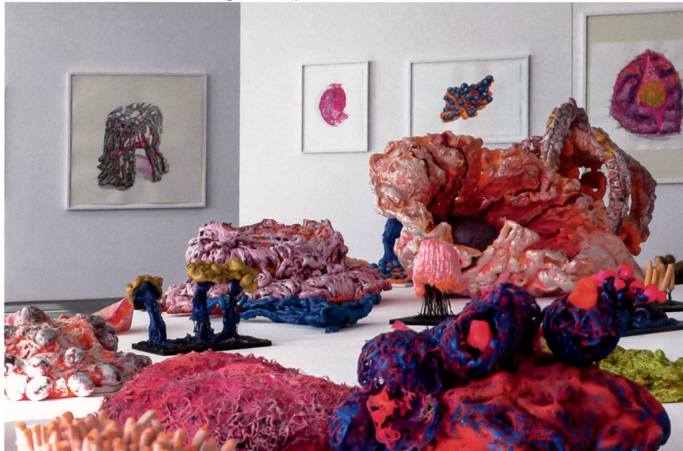
CHRISTIAN GREUTMANN Ausstellung 2019 | Exposition 2019