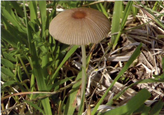
PARASOLA AURICOMA Braunhaariger Tintling | Coprin à soies brunes