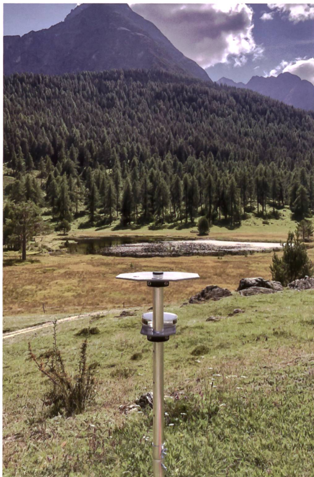
Fig. 3 Piège à spores spécifiquement conçu. L'analyse de l'ADN des spores de champignons capturés sur le filtre circulaire offre une image de la biodiversité régionale.

Abb. 3 Eigens konstruierte Sporenfalle. Eine DNA-Analyse der auf dem runden Filterpapier abgelagerten Pilzsporen ermöglicht später ein Bild der regionalen Artenvielfalt.