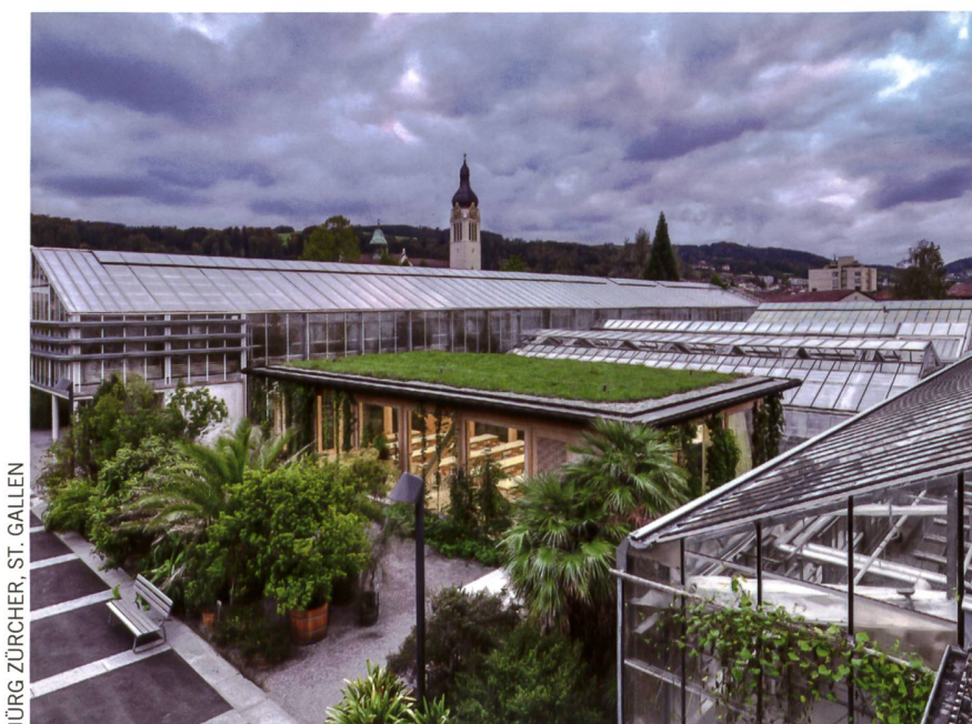
JÜRIG ZÜRCHER, ST. GALLEN

Die Stadt ist längst wieder eine blühende, äusserst attraktive Stadt und beheimatet aktuell über 80000 Einwohnerinnen und Einwohner. Wir heissen Sie herzlich willkommen in der Gallusstadt und laden Sie zu einer Entdeckungstour ein.