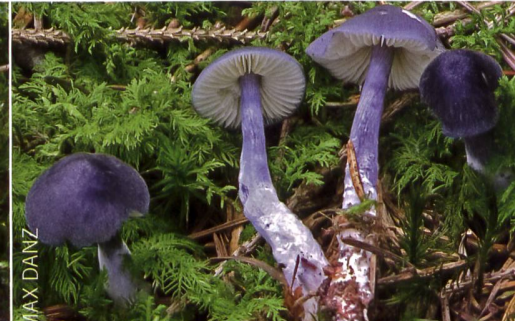
ENTOLOMA NITIDUM Stahlblauer Rötling