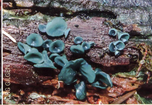
CHLOROCIBORIA AERUGINASCENS Grünspanbecherling