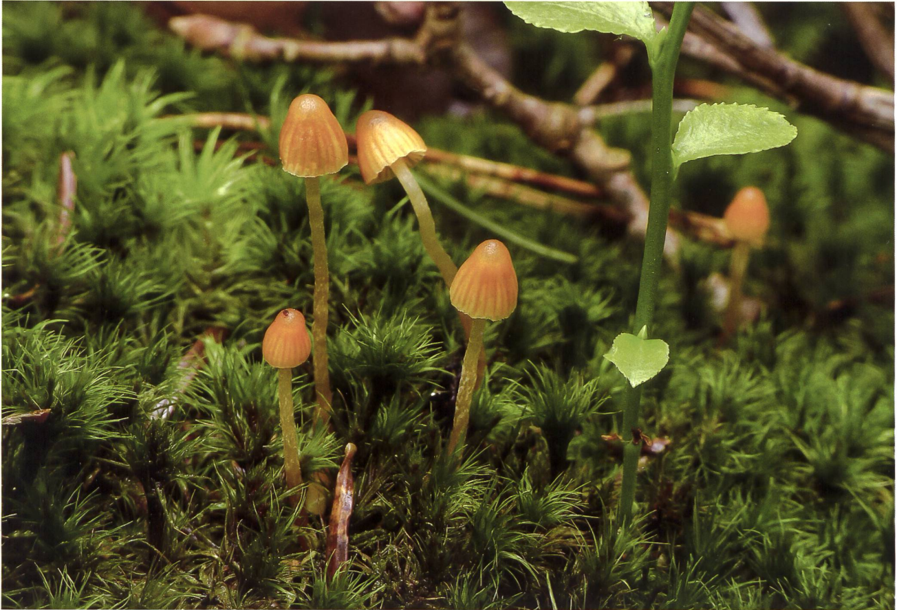
GALERINA CERINA Wachs-Häubling | Galère cirée