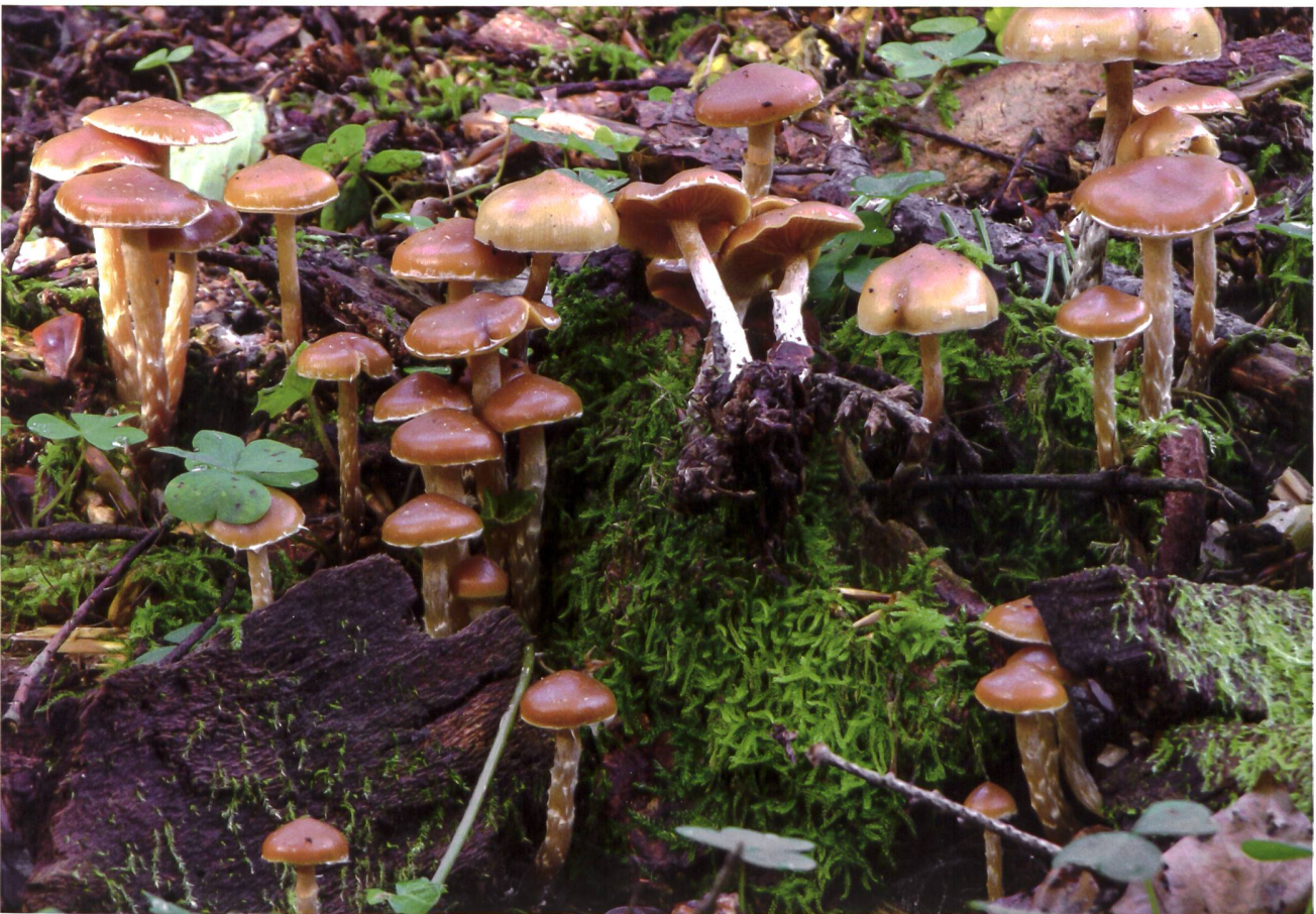
GALERINA MARGINATA Gift-Häubling | Galère marginée