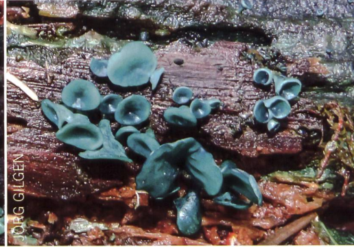
CHLOROCIBORIA AERUGINASCENS Grünspanbecherling