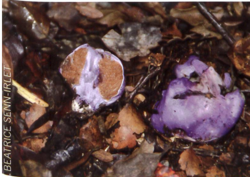
CORTINARIUS (THAXTEROGASTER) PORPHYROIDEUS Lila-Beutelpilz (Neuseeland)