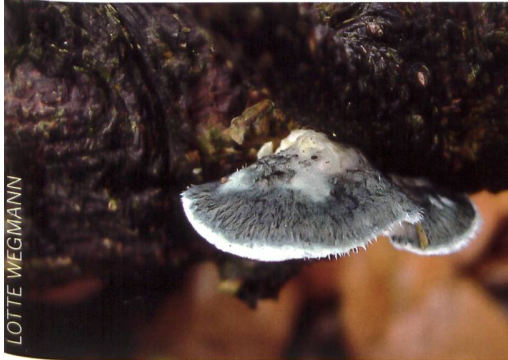
CYANOSPORUS (POSTIA) CAESIUS Blauer Saftporling