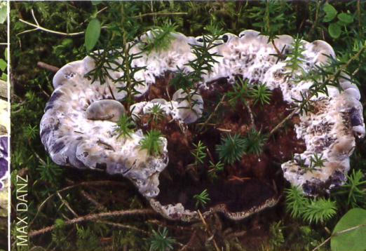
HYDNELLUM CAERULEUM Bläulicher Korkstacheling