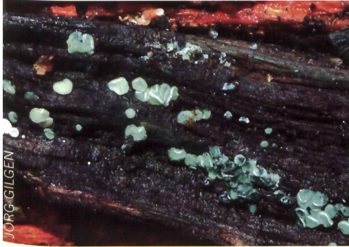
ERINELLA AERUGINOSA Smaragdgrüner Eichenbecherling