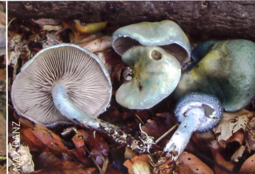
STROPHARIA CAERULEA Grünblauer Träuschling