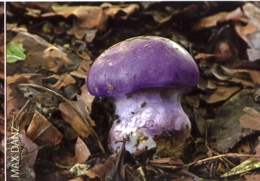
CORTINARIUS CAERULESCENS Blaufleischiger Klumpfuss