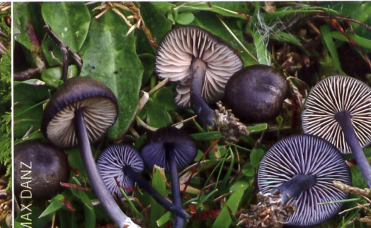
ENTOLOMA CORVINUM Schwarzblauer Rötling