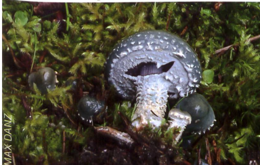
STROPHARIA AERUGINOSA Grünspan-Träuschling