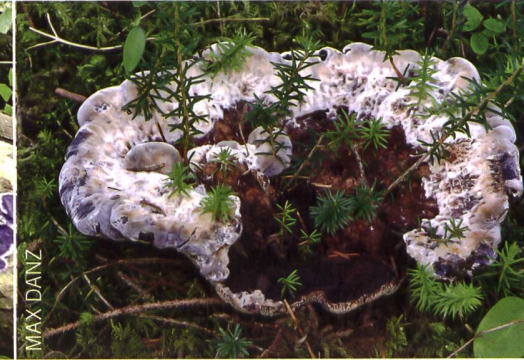
HYDNELLUM CAERULEUM Bläulicher Korkstacheling