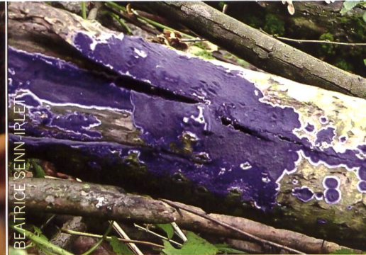
TERANA COERULEA Blauer Rindenpilz