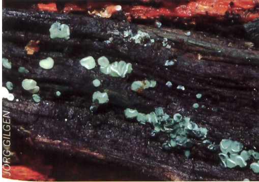
ERINELLA AERUGINOSA Smaragdgrüner Eichenbecherling