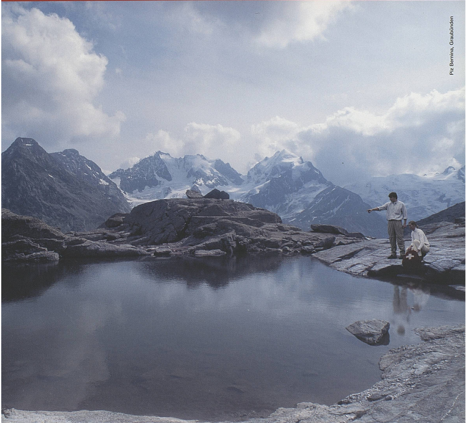
Piz Bernina, Graubünden