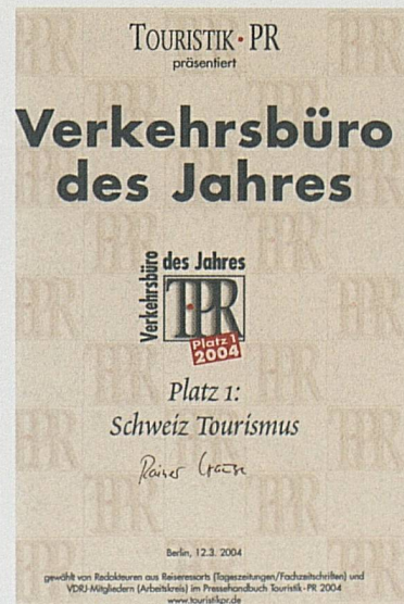
Grande onore per il lavoro di ST Germania. Big honour for the work of ST Germany.

The flurry of awards culminated in the prestigious "Xaver" ("the Swiss event industry Oscar") that ST received in the premium "Event, Business" category for the opening ceremony at the Switzerland Travel Mart (STM), where the full diversity of the tourism offering – in the shape of 120 actors and 30 animals – marched through the ABB Hall in Zurich.