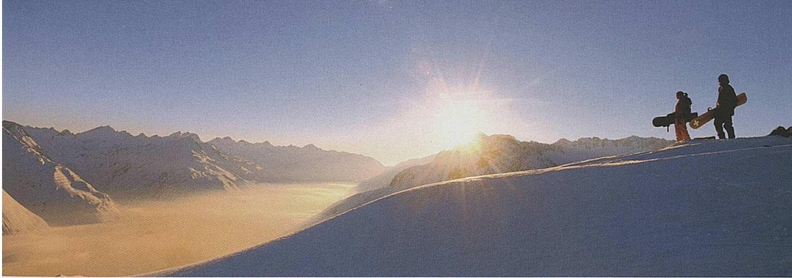
ST si è distinta anche in diversi premi del settore turistico. (Nätschen presso Andermatt, Svizzera centrale) Switzerland Tourism hit the heights with a host of tourism awards. (Nätschen, near Andermatt, Central Switzerland)