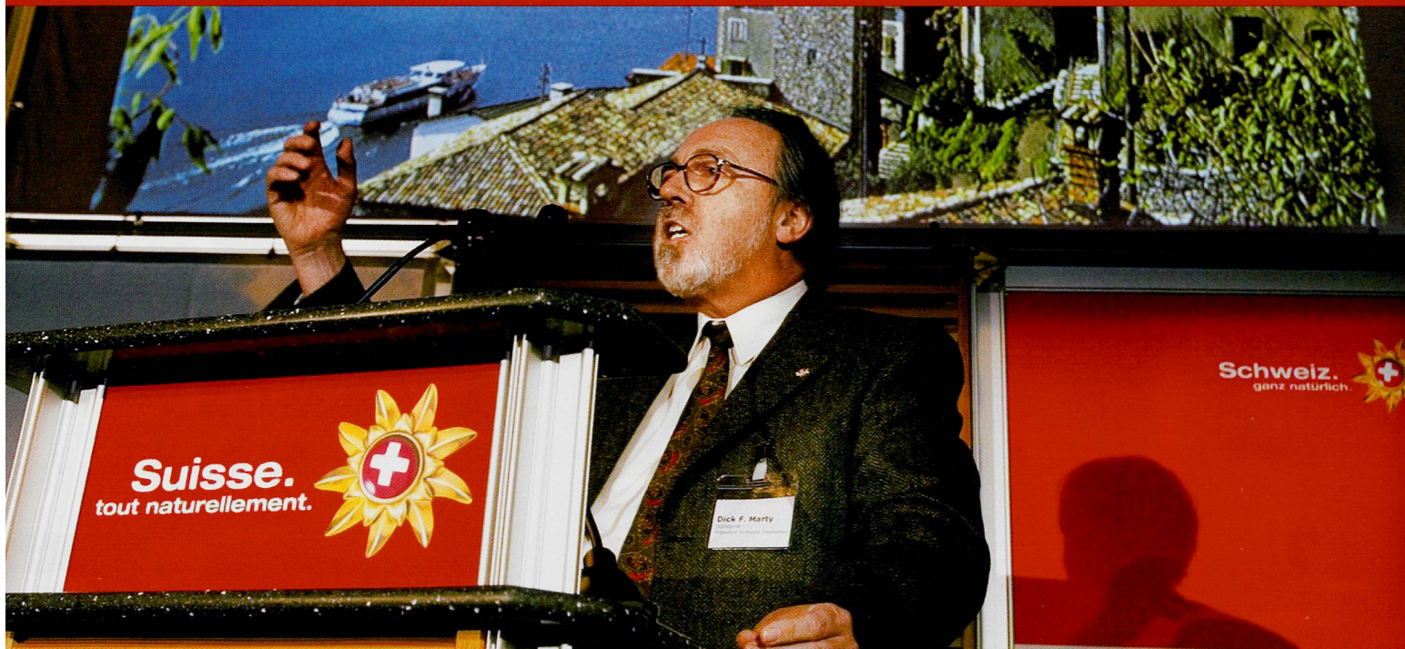
Dick F. Marty è stato presidente di Svizzera Turismo per undici anni, usando impegno, dedizione e prudenza. Eleven years of prudent and committed work as President of Switzerland Tourism: Dick F. Marty.