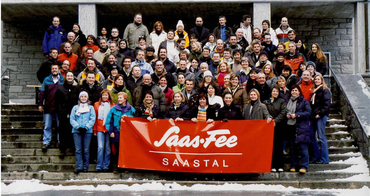
Lo staff internazionale di ST si incontra regolarmente in occasione di workshop e seminari strategici: la sede di quest'anno è stata Saas-Fee. ST's international team meets up regularly for workshops and strategic seminars: this time they gathered in Saas-Fee.