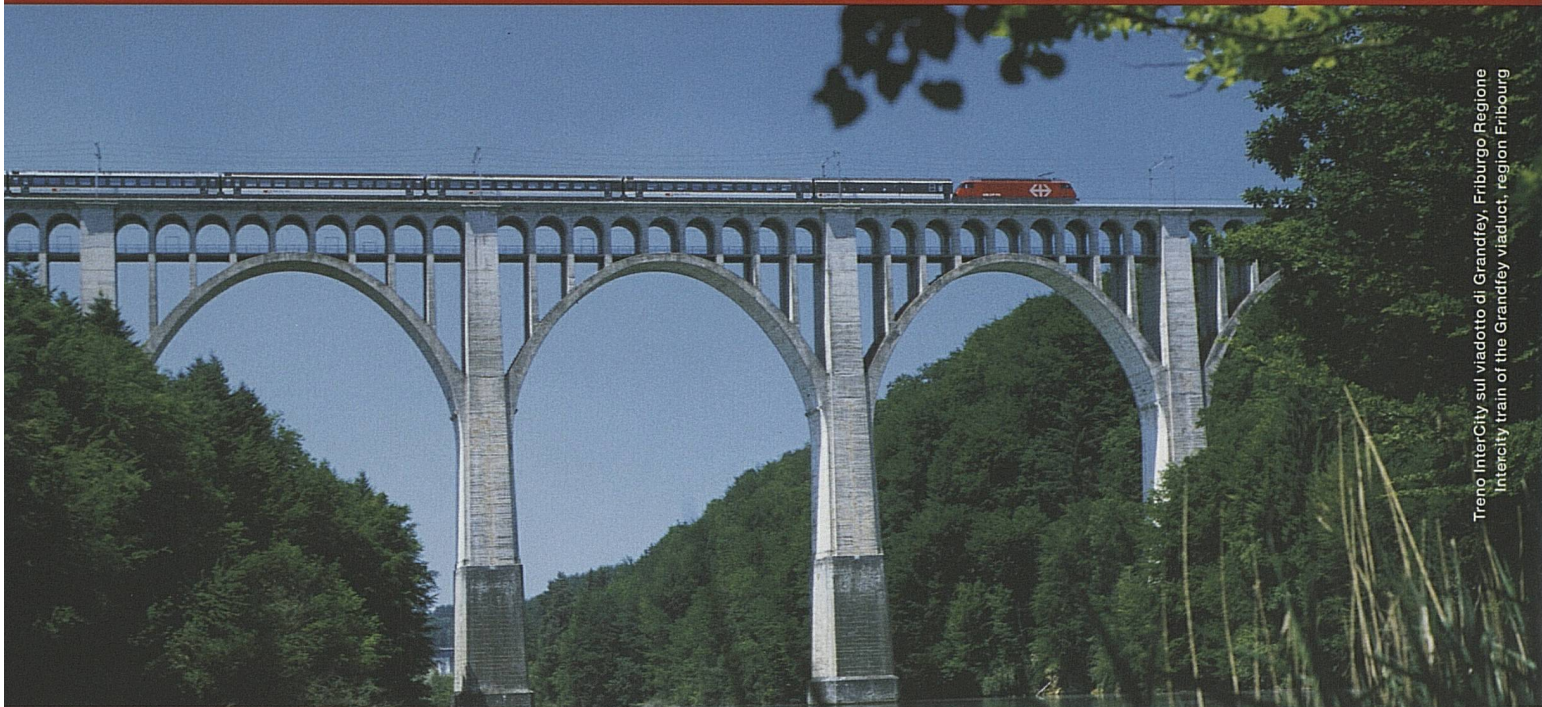
Treno InterCity sul viadotto di Grandfey, Friburgo Regione Intercity train of the Grandfey viaduct, region Fribourg

Viaggiare comodamente attraverso uno spettacolo: come partner di ST, le FFS trasportano ogni anno 170 gruppi di giornalisti e addetti turistici esteri. A spectacular ride in comfort: as a partner of ST, SBB transports every year 170 groups of foreign journalists and travel trade professionals.