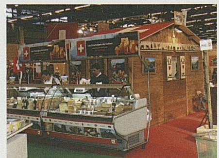
...e Switzerland Cheese Marketing. ...and Switzerland Cheese Marketing.