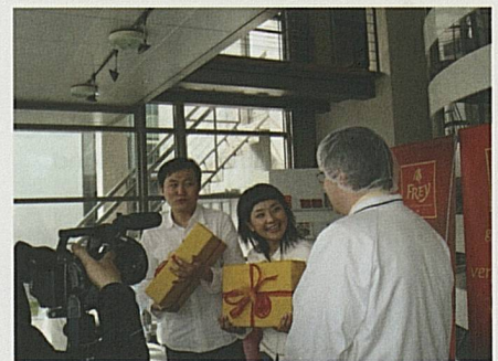
Leccornie sempre garantite: Chocolat Frey... Offering regular treats: Chocolat Frey...

When it comes to whetting the appetite of foreign markets for Switzerland, culinary delights are invaluable. Thanks to partnerships with Switzerland Cheese Marketing (SCM) and Chocolat Frey, Swiss quality can be guaranteed every time. Other partners help ST with the optimal running of promotions, trade fairs and media trips.