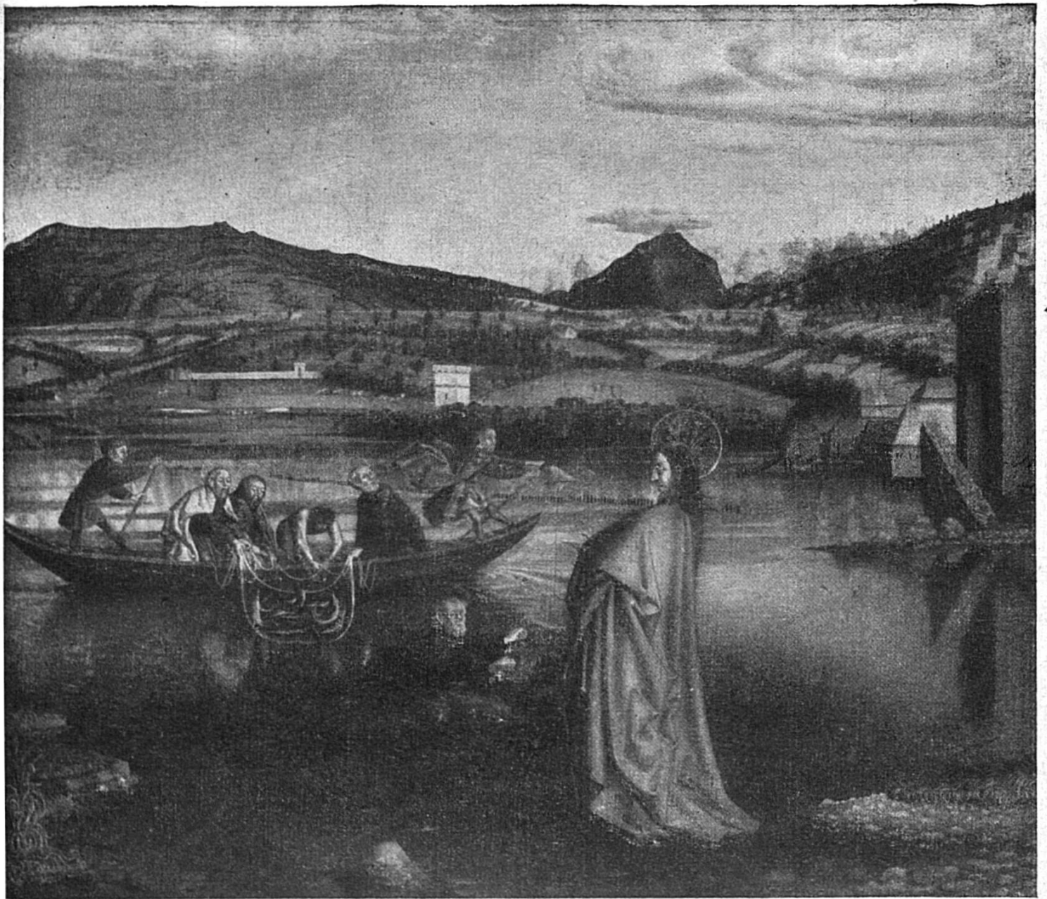
Conrad Witz: Der wunderbar Fischfang

NB. Das Bild vo der Gänfer Seebucht isch eis vo den erste Landschaftsbilder i der Schwyz.