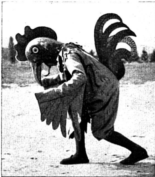
Das isch der Guggel us dr „FRAU HOLLE.“

Völlig ungewohnt wirkte das anheimelnde Mundartsprechen im klassischen Märchenland, und gerade in dieser Lebensnähe, die der Dialekt den bekannten Märchenfiguren gab, lag ein Hauptmoment der starken, unmittelbaren Wirkung.