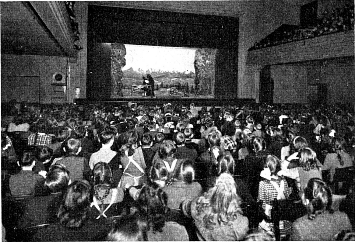
In ere Chindervorstellig am Namittag