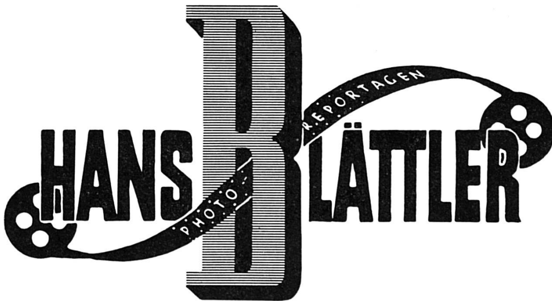
PHOTO- UND CINÉGESCHÄFT

Gmeint ist das i Stadt und Land bestbekannti