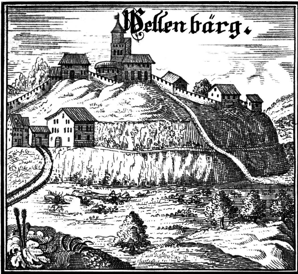
Wellenberg einst. (Aus Bluntschlis Memorabilia 1742.)