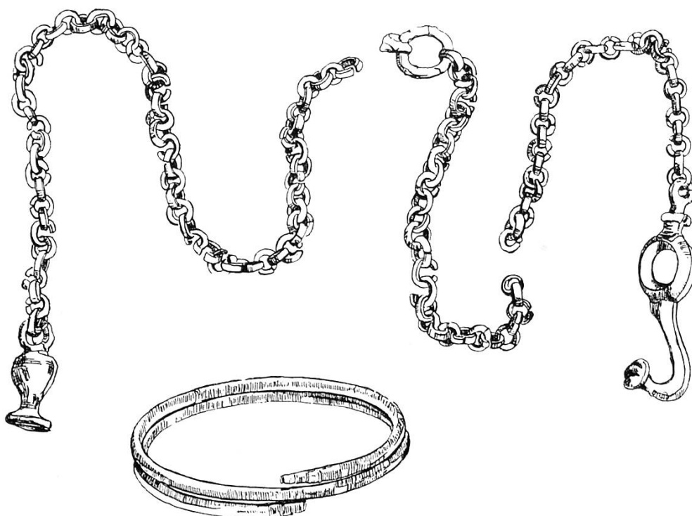
Abb. 1. Latènegrab Ermatingen. \frac{1}{2} Gr.