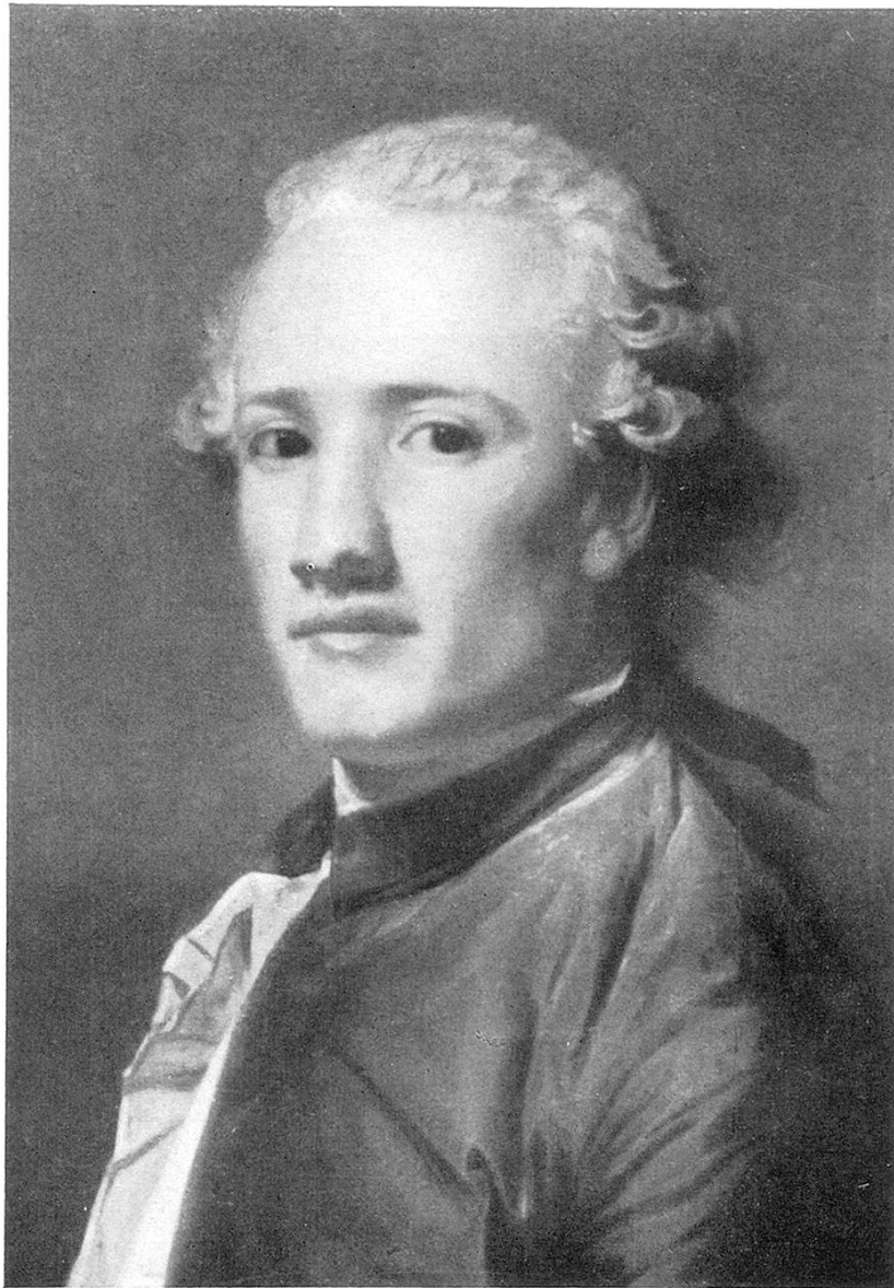
Jean-Georges Meuricoffre geboren 13. Oktober 1750, gestorben 1806