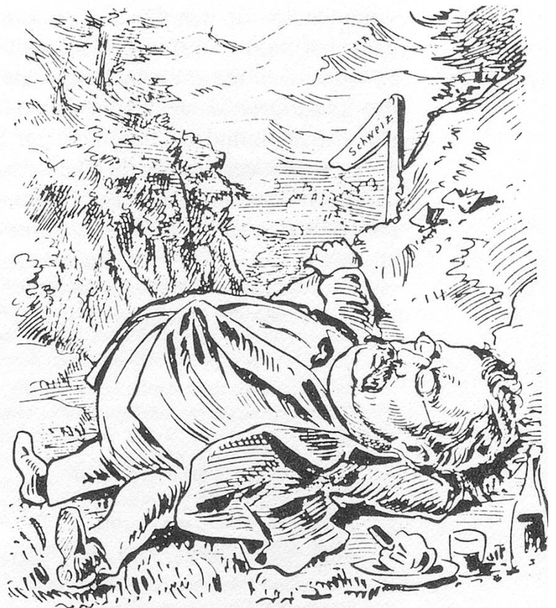
Herr Anderwert besessigt die äußere und innere Sicherheit der Schweiz.