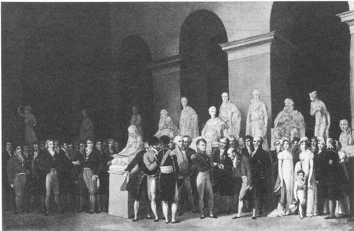
Fig. 2. L. L. Boilly, Napoléon remet la Légion d'Honneur au sculpteur Cartellier . Arenenberg, Musée Napoléon.