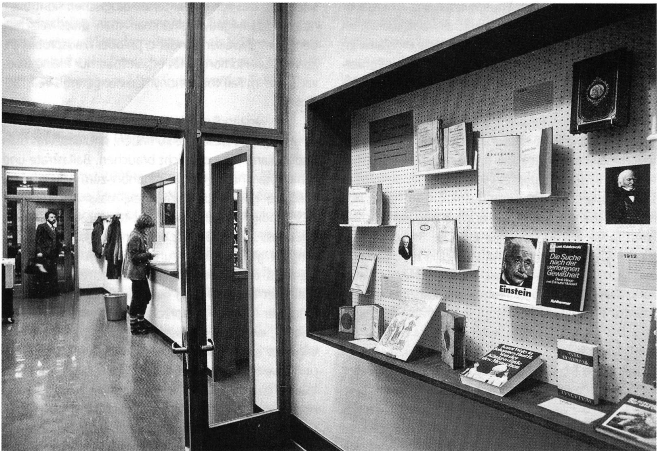
Abb. 42: Blick zum Ausleihschalter der Kantonsbibliothek im 1. Obergeschoss des Gebäudes im Jahr 1980, kurz bevor im Erdgeschoss die Freihandbibliothek eingerichtet werden sollte; rechts im Bild ein Schaukasten, in dem die Bibliothek Kleinstausstellungen zeigte, einmal sogar Johann Adam Pupikofer und Albert Einstein zusammen.

«Thurgau»; letzterer wurde um einen speziellen Thurgauer Personenkatalog erweitert. 1986 unternahm sich Stephan Gossweiler die Fleissaufgabe, die bis 1971 nachgeführte Abteilung «Thurgau» im Rahmen einer Diplomarbeit in den neuen Sachkatalog von 1972 umzuordnen, zu ergänzen, auszubauen und zu verbessern. 78 In der Folge betreute Gossweiler die Thurgauer Bibliografie sowohl in Form des Zettelkastens als auch, wie erwähnt, in gedruckter Form (und wurde so nach und nach zum «Mister Thurgau» der Kantonsbibliothek).