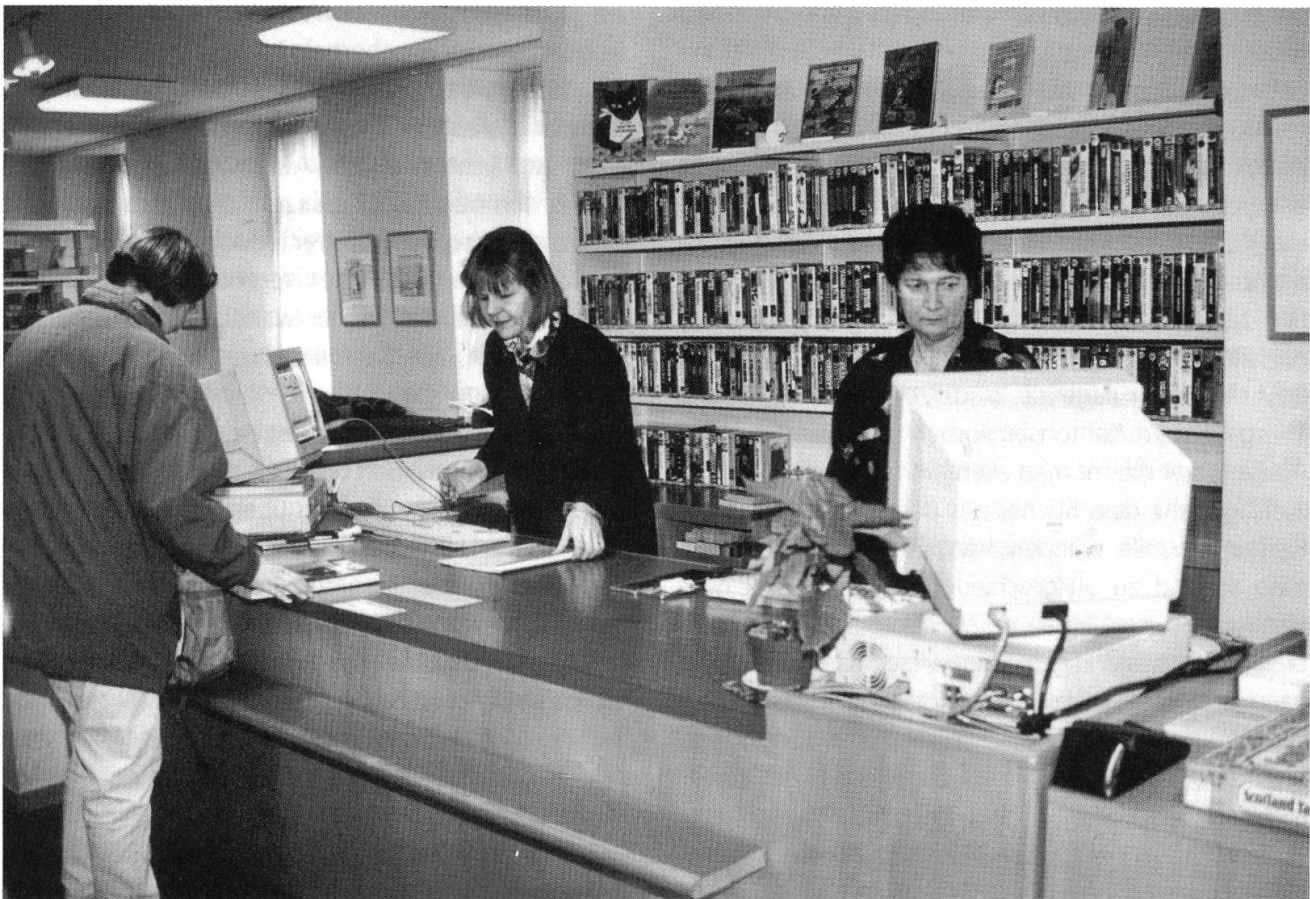
Abb. 44: Einzug der Moderne (1994) – seither wurden die Bildschirme etwas flacher ...

Späths Sacramento-Erstaussgabe 123 ), von denen es keine Dubletten im Magazin gibt. Wäre demnach eine (wenn auch absurde) Folge, dass andere kantonale Institutionen wie das Staatsarchiv für die Kantonsbibliothek in die Bresche springen müssen, um zu verhindern, dass «wichtige» Werke auf dem Verbrauchsweg vernichtet und der Forschung entzogen werden?