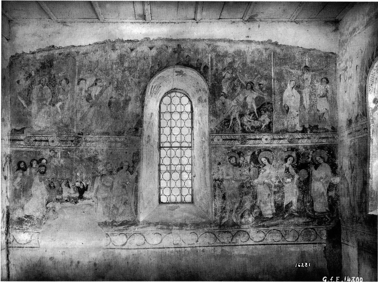
Abb. 64: Vom Historischen Verein gerettet: Wandgemälde von etwa 1400 im Chor der Kirche von Frauenfeld-Kurzdorf. Aufnahme vor der Restaurierung von 1915.

der Vorstand dagegen, dass die gotischen Spitzbogenfenster im Kreuzgang des ehemaligen Frauenklosters Paradies «durch einen fremden Antiquar» nach Deutschland transferiert wurden, was durch die Zusicherung eines Beitrags seitens des Historischen Vereins, der Schweizerischen Gesellschaft für Erhaltung historischer Kunstdenkmäler und des Historisch-antiquarischen Vereins des Kantons Schaffhausen an die Neuverglasung auch gelang. 24 Um 1918 liess der Historische Verein das «Feldbacher Altarbild» und zwei Flügel eines weiteren, unbekanntes Altars restaurieren. 25 Daneben traten vor allem Wandmalereien ins Zentrum seiner Aufmerksamkeit. 1915 kam der