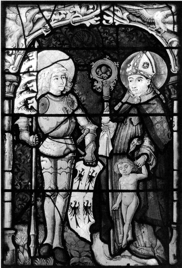
Abb. 63: Objekt der Begierde in der «Gachnanger-Scheiben-Affäre»: Glasgemälde von 1495 mit den Heiligen Mauritius und Martin.

neue erstellen lassen. Dem Vorstand des Historischen Vereins wurde zugetragen, die Glasgemälde seien verkäuflich, worauf er 500 Franken bot, um sie für seine kantonale historische Sammlung zu erwerben. Nach einiger Zeit vernahm er, von anderer Seite seien 800 Franken geboten, so dass er sein Angebot auf 1000 Franken steigerte. Etwas später erhöhte der Dritte auf 1300 Franken. In der Folge wandte sich der Historische Verein an den Bundesrat mit dem Gesuch um eine Subvention, doch bekam er bis zur entscheidenden Kirchgemeindeversammlung keine Antwort. Der Verein veranlasste die Verschiebung der Kirchgemeindeversammlung und sandte ein zweites Beitragsgesuch nach Bern, worauf er von der zuständigen