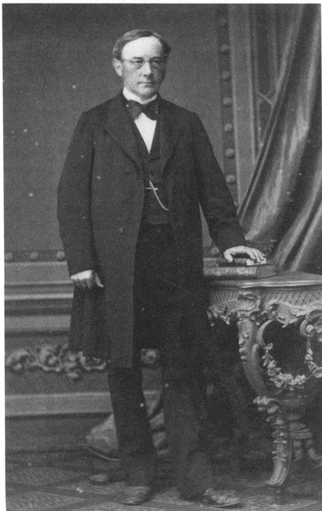
Abb. 25: Johann Konrad Kern (1808–1888) stammte aus Berlingen und startete ab 1832 eine beispiellose politische Karriere, zunächst auf kantonaler, später auf nationaler Ebene. «Minister» Kern prägte als Redaktor die Bundesverfassung von 1848 und wirkte 1857–1883 als Gesandter der Schweiz in Paris.

welche diese Sache einfädelt. Je detaillierter die eingesetzte Revisionskommission die Unterlagen studierte, desto eindeutiger wurde der Tatbestand der Unterschlagung durch Heinrich Freyenmuth. Er wurde 1852 fristlos entlassen und den Strafverfolgungsbehörden überstellt.