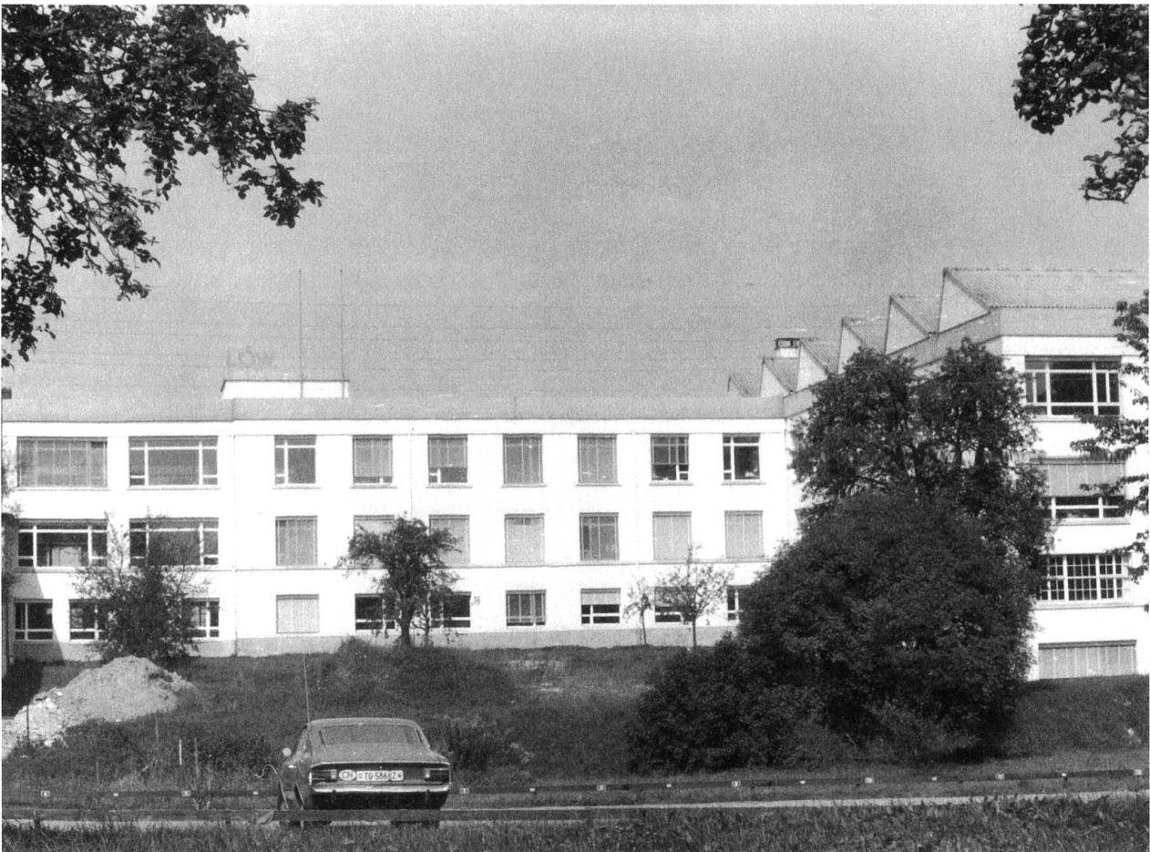
Abb. 32: Das Löw-Areal in Oberaach, Aufnahme 1970er-Jahre.