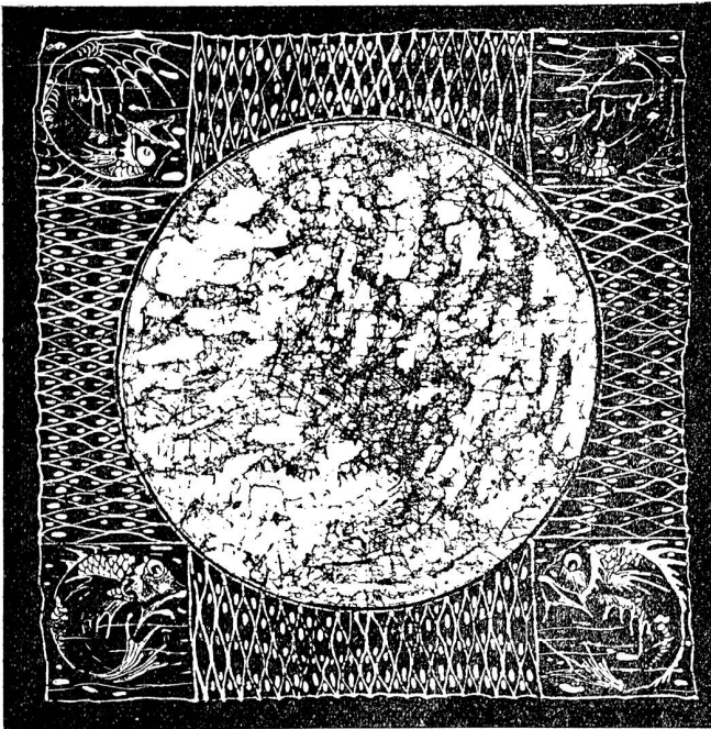
Zierdeckchen in Batik.

Der Stoff wird dann wieder in ein Farbbad gebracht, das um eine oder mehrere Nuancen tiefer ist, als das erste und zu diesem einen guten Mischton ergibt. Dieses Verfahren kann dann, je nach den gewünschten Effekten, beliebig häufig angewandt werden. Einem geschickten Farbentechniker ist damit, das erkennt jeder Fachmann sofort, auch wenn ihm noch nie ein Batikstoff zu Gesicht gekommen ist, noch dazu, wenn ein guter Zeichenmusterentwurf zur Verfügung steht, die Möglichkeit zur Erzielung geradezu prachtvoller Effekte der Farbgebung in pastellen und dunklen Spielen von grossflächiger Pointierung bis zu mosaikartiger Feinheit gegeben.