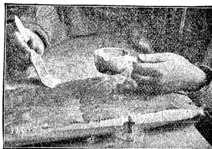
Das Anlegen grösserer Flächen mit dem Pinsel.

den letzten Jahren zahlreich gewesen. Leider aber blieben sie für die Industrieverwertung bis jetzt fruchtlos, weil zur Erzielung der Batik bisher nur das javanische Arbeitsinstrument, das „Tjanting“, bekannt war, das sich in unserem kälteren, nordischen Klima zu einer gewerblich nutzbringenden Arbeit nicht verwenden liess, denn es ist seiner ganzen Gestaltung nach lediglich auf den Gebrauch in äquatorialen Ländern zugeschnitten.