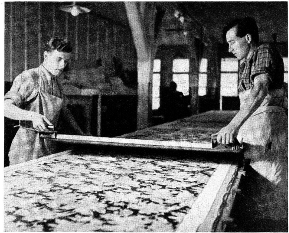
Abb. 10. Stoffdrucker

schinen, während Abb. 8 das Rohgewebe, so wie es vom Webstuhl kommt, darstellt.