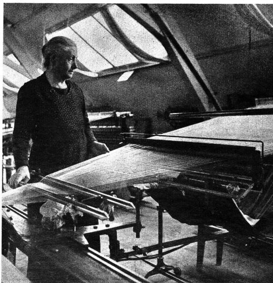
Abb. 6. Zettlerin

In enger Zusammenarbeit mit dem Disponenten arbeitet der Dessinateur eigene oder gegebene Ideen und Winke in Formen und Farben aus. Aus einer flüchtig angedeuteten Idee entsteht ein „Croquis“ und aus diesem ein ein- oder mehrfarbiger Entwurf, welcher den Stoff in seiner gewünschten Musterung darstellt. Dabei muß die Verteilung der Formen in bestimmter Gesetzmäßigkeit innerhalb eines „Rapportes“