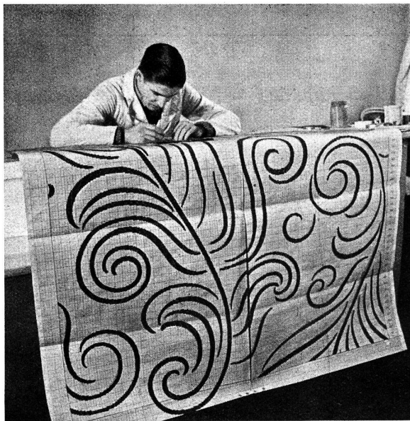
Abb. 2. Patroneur

Der Laie weiß meistens nicht, daß sogar einfach aussehende Stoffe, sogen. „Uni“-Gewebe, eine gründliche technische Vorarbeit erfordern. „Das ist doch nur ein ganz einfacher Stoff“, denkt manche Dame beim Einkauf; „da braucht es doch sicher kein besonderes Können dazu“, hört man hin und wieder sagen. Solche Meinungen sind falsch. Der Mann, welcher die Aufgabe hat, neue Stoffe auszuarbeiten, muß nicht nur über ein reiches technisches Wissen und Können verfügen, sondern er muß auch schöpferisch veranlagt und ein guter Beobachter