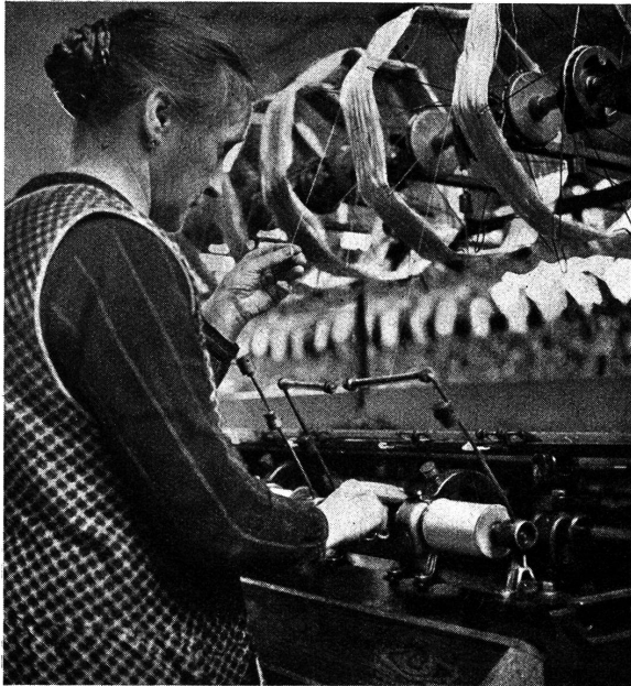
Abb. 5. Winderin

Epochen kennen, um bestimmte Aufgaben stilgerecht lösen zu können. Im weitem muß er die Gesetze über Farbharmenie und Farbenkontraste beherrschen, damit seine Entwürfe nicht nur in den Formen, sondern ganz besonders in den Farben das Auge der wählerischen Käuferinnen erfreuen und begeistern.