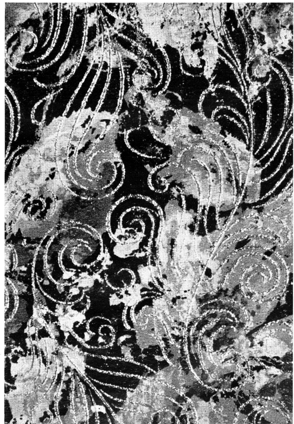
Abb. 11. Bedruckter Stoff

Nun soll das Gewebe aber noch bedruckt werden. Es reist daher vom Webstuhl in die Druckerei, wo inzwischen das Druckdessin vorbereitet worden ist. Ein reiches Blumenmuster in 16 Farben soll zur weiteren Verschönerung des Stoffes auf-