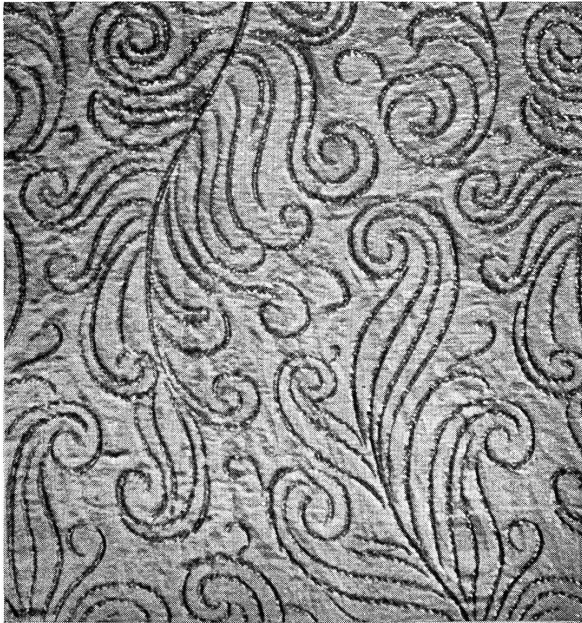
Abb. 8. Rohgewebe mit Jacquarddessin.

viele Tausend Fäden umfassenden Zettel, während der Webermeister den Stuhl vorbereitet. Dann wird die Kette auf den Stuhl gelegt und jeder einzelne Kettfaden in den Harnisch und das Webeblatt eingezogen. Nachdem der Webstuhl und die Jacquardmaschine genau eingestellt sind, kann die Weberin mit ihrer Arbeit beginnen. Wenn auch die Weberin heute keine mühsame Handarbeit mehr ausführen muß, so erfordert ihre Tätigkeit doch eine stete Aufmerksamkeit und Ueberwachung von Stuhl und Kette, weil jeder gebrochene Faden, welcher nicht sofort wieder angeknüpft und eingezogen wird, einen Fehler im Stoff zur Folge hat. Unsere Abb. 5—7 zeigen die Winderin, Zettlerin und Weberin an ihren Ma-