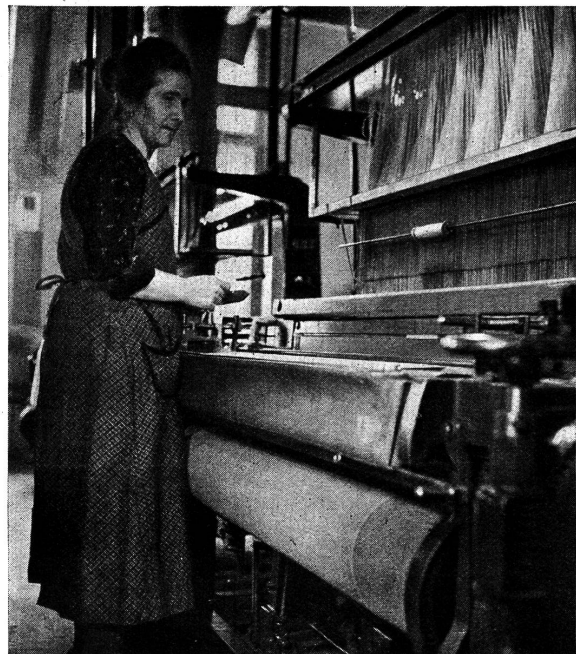
Abb. 7. Jacquardweberin

Die fertige Patrone muß nun noch „geschlagen“ werden. Dabei wird das Bild der Patrone, Punkt für Punkt, Karte für Karte, auf ein endloses Papier übertragen, wobei die Figur gelocht oder geschlagen wird, während der Grund ungeschlagen bleibt. Diese Arbeit besorgt der Kartenschläger auf der