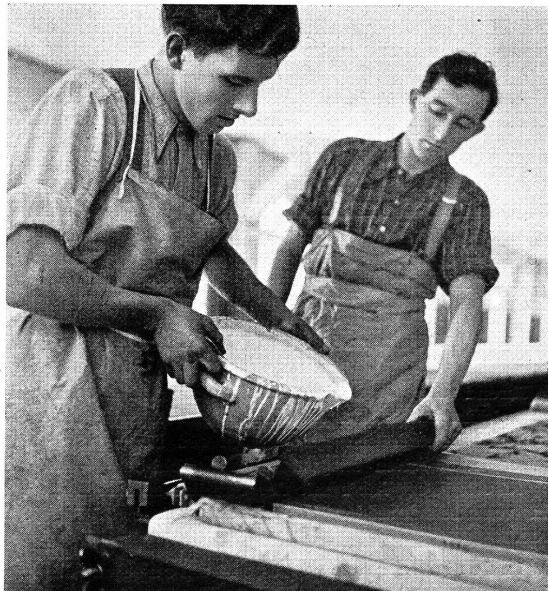
Abb. 9. Stoffdrucker

viele Tausend Fäden umfassenden Zettel, während der Webermeister den Stuhl vorbereitet. Dann wird die Kette auf den Stuhl gelegt und jeder einzelne Kettfaden in den Harnisch und das Webeblatt eingezogen. Nachdem der Webstuhl und die Jacquardmaschine genau eingestellt sind, kann die Weberin mit ihrer Arbeit beginnen. Wenn auch die Weberin heute keine mühsame Handarbeit mehr ausführen muß, so erfordert ihre Tätigkeit doch eine stete Aufmerksamkeit und Ueberwachung von Stuhl und Kette, weil jeder gebrochene Faden, welcher nicht sofort wieder angeknüpft und eingezogen wird, einen Fehler im Stoff zur Folge hat. Unsere Abb. 5—7 zeigen die Winderin, Zettlerin und Weberin an ihren Ma-