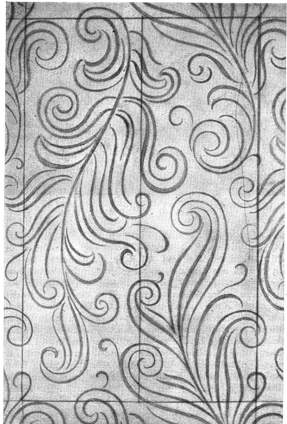
Abb. 1. Entwurf

Wir haben im Laufe des Sommers in unserer Fachschrift (No. 8/1939) auf einen Aufsatz in der „Schweizerischen Werkzeugzeitung“ hingewiesen, welcher diese Arbeiten in Wort und