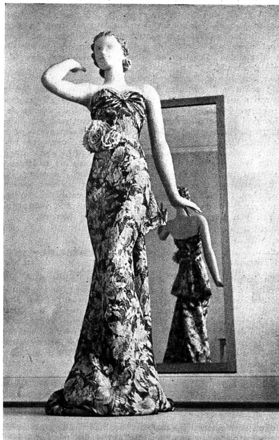
Abb. 12. Festliches Abendkleid

Verdient die schöpferische Arbeit der Disponenten, die Kunst der Dessinateure und Drucker, das Können der Patroneure und Kartenschläger und alle die sorgfältige Kleinarbeit der Winderinnen, Zettlerinnen, Spulerinnen und Weberinnen nicht auch etwas Anerkennung? R. H.