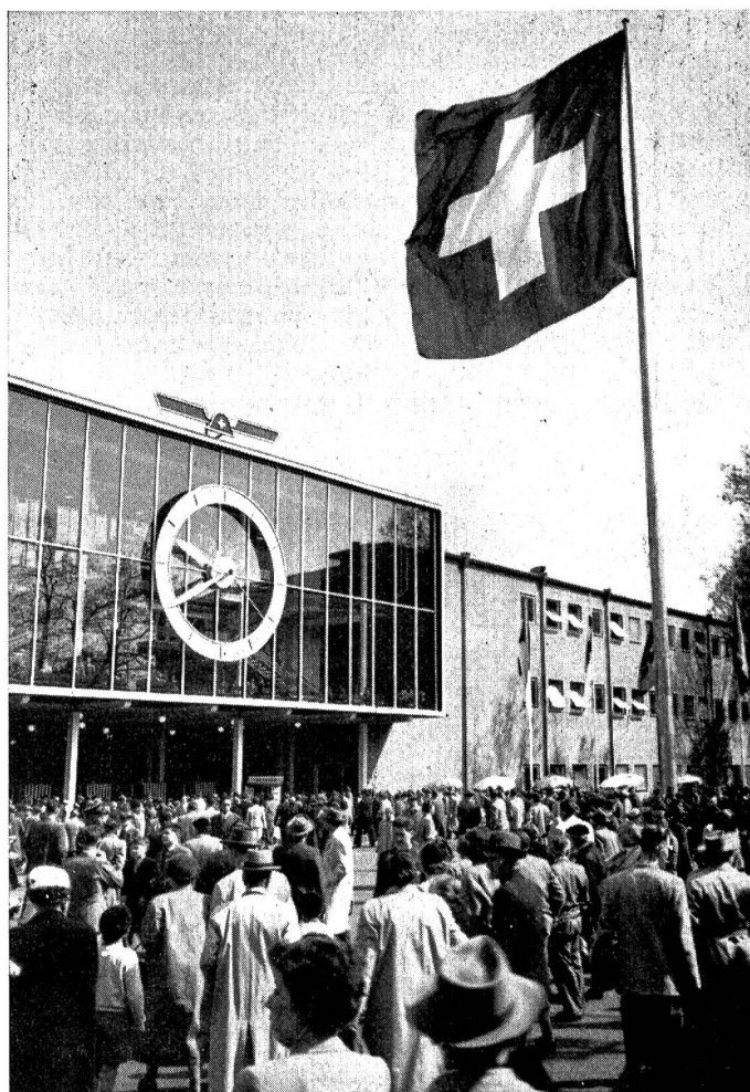
Basel, am Haupteingang zu den neuen Messehallen

Zweifellos werden an der kommenden Mustermesse wiederum zahlreiche Neuheiten, nicht nur im Hinblick auf das Material, sondern vor allem im Hinblick auf die Dessins, die Farben und Formen, zu sehen sein. Die Wollweberei bringt verschiedene Nouveautés. Daneben werden auch kostbare Seiden- und Baumwolldrucke zu sehen sein. In der Gruppe «Konfektion» begegnen uns modische Regenmäntel und hübsche Schürzen. Repräsentativ beteiligt sich wie immer die Herrenwäsche an der kommenden Mustermesse, wobei die Auswahl vom Hemd mit einer wieder einmal erneuerten Kragenform bis zum Herren-Housedress reichen wird. Die Strickwaren bringen eine Tricotneuheit aus feinsten Baumwolle. Ferner werden neue Trainingsanzüge und zahlreiche andere Neuerscheinungen erstmals an der Messe zu sehen sein. Zum erstenmal begegnet uns dort eine anti-elektrische Wäsche, welche sicher auch in weitesten Kreisen auf Interesse stoßen wird. Einen würdigen Platz wird auch die Handstickerei einnehmen; das Angebot an Strickwolle erwartet uns in gewohnter Reichhaltigkeit. Hier sind als Neuheiten die bedruckten Wollgarne zu nennen. Auf dem Gebiete der Damenwäsche erwartet uns unter anderem eine Campingkollektion. Diese neue Mode-richtung findet in letzter Zeit auch im Ausland großen Anklang. Zur Herstellung dieser Wäsche wird zum Teil