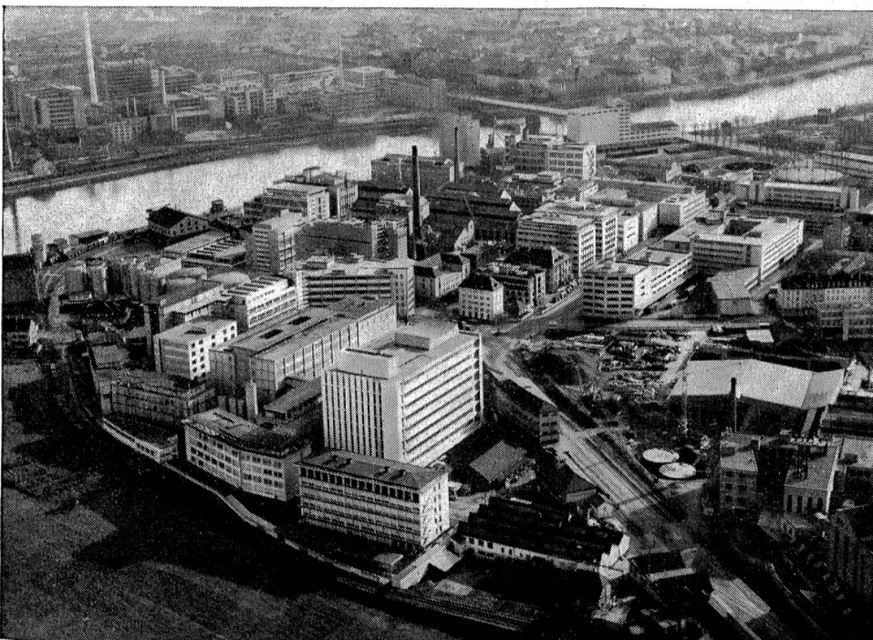
SANDOZ AG., Basel

von zehn Arbeitern und einer Dampfmaschine von 15 PS den Betrieb der «Chemischen Fabrik Kern und Sandoz» aufnahmen. Aus der kleinen Farbstoff-Fabrik entwickelte sich im Laufe der Jahrzehnte ein Großunternehmen der chemischen Industrie, das heute über 25 Tochtergesellschaften in Europa und Uebersee umfaßt. Dem einen