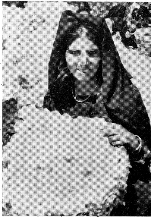
Nach der Ernte. Junge Aegypterin beim ersten Reinigen der gepflückten Baumwolle auf dem Feld, das irgendwo im Nildelta liegt.

Langstaplige ägyptische Baumwolle. — In Verbindung mit der Publizitätsstelle der Schweizerischen Baumwoll- und Stickereiindustrie, den ägyptischen Baumwollerzeugern und der Firma Oscar Weber in Zürich fand vom 26. Juni bis 1. Juli in den Räumen des Warenhauses Oscar Weber eine «Aegyptische Baumwollwoche» statt. Eine Ausstellung im zweiten Stock warb für ägyptische Baumwolle, und täglich wurden vor- und nachmittags rund 70 Baumwollmodelle aus verschiedenen europäischen Ländern — auch aus der Schweiz — und aus Aegypten zur Schau gebracht. Die Ausstellung wie diese Modeschauen vermochten der breiten Käuferschar einen Ueberblick über die Entstehung der Baumwolle in Aegypten und über das weite Verwendungsgebiet dieser langstapligen Baumwolle zu geben. Es ist jene weiße, weiche, langstaplige Faser, von der Natur geschaffen mit allen guten Eigenschaften, die natürliche Fasern haben. Sie wurde gesponnen, gewebt, veredelt, in Kleider und Mäntel verwandelt, wie auch in duftige Wäsche und in Bezüge für Tisch und Bett. Die gezeigten Modelle vom Strand- zum Nachmittagskleid, vom Cocktailkleid zur Abendrobe, in Schaff, Druck, Jacquard und Stickerei wurden nicht nur als Querschnitt aus dem europäischen Modeschaffen präsentiert, sondern auch als Erzeugnisse jener vielen fleißigen, anonymen Kräfte auf den Baumwollfeldern und in den Verarbeitungsbetrieben vorgestellt.