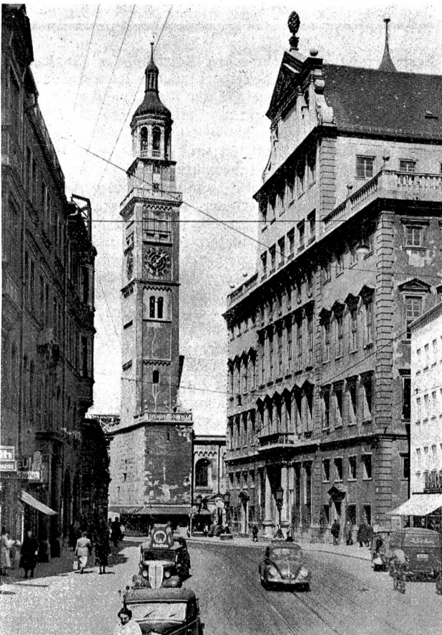
Augsburg: Carolinenstraße mit Perlachturm und Rathaus

Augsburg , eine Weltstadt des Mittelalters, ist eine der ältesten deutschen Städte. Ihr Gründer war der römische Kaiser Augustus. Seit altersher ist die Stadt ein Schnittpunkt wichtigster kontinentaler Verkehrsverbindungen, wodurch sie besonders im Mittelalter in hohem Ansehen stand. Die Bürger der alten Bischofsstadt erreichten im 13. Jahrhundert die Reichsfreiheit. Durch die geldmächtigen Fugger und die seefahrenden Welser erhielt Augs-