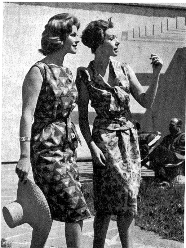
Ferienkleider; 100 % Baumwolle — Leinenstrukturgewebe von Franz M. Rhomberg, Dornbirn.

gen der Schweiz entspricht. Ihre Integrationsorgen tangieren die schweizerischen, wie auch viele weitere wirtschaftspolitischen Fragen. Diese Verbundenheit mag sich symbolisch in der historischen Begebenheit dokumentieren, daß der Freiheitsbrief der Stadt Feldkirch seit dem Jahr 1376 im Staatsarchiv der Stadt Zürich in Verwahrung ist, — «Zürich sei der sicherste Ort für dieses Dokument».